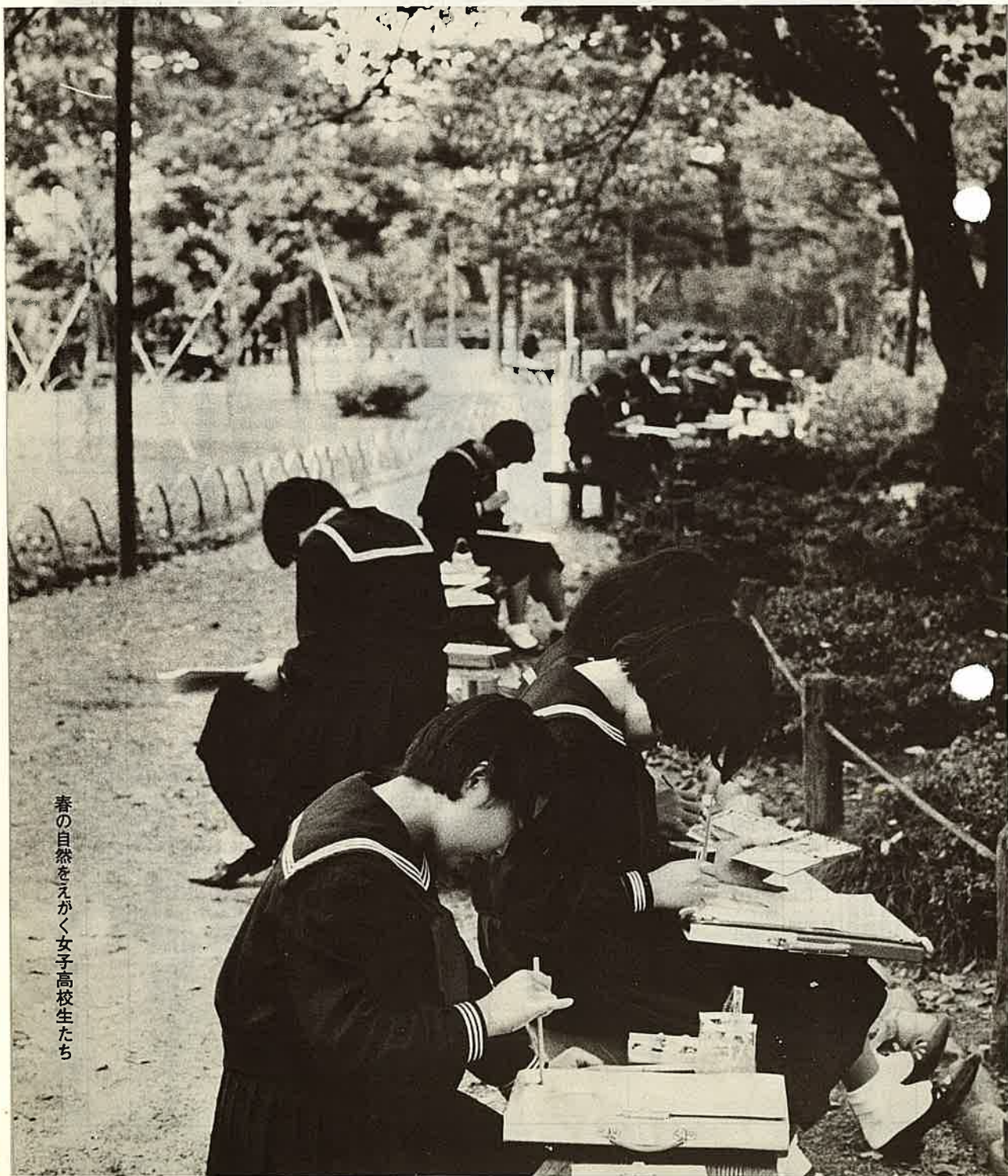
春の自然をえかく女子高校生たち