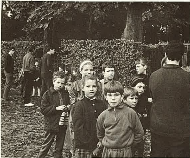
ヨーロッパの子どもたちは行儀がよくおとなしい —フランスにて写す—

ただ、わずか三週間の旅程ではもとより理解十分とは言えない。それだけに印象的、直感的なとらえ方であることをおわびして終りにします。(大原小学校長)