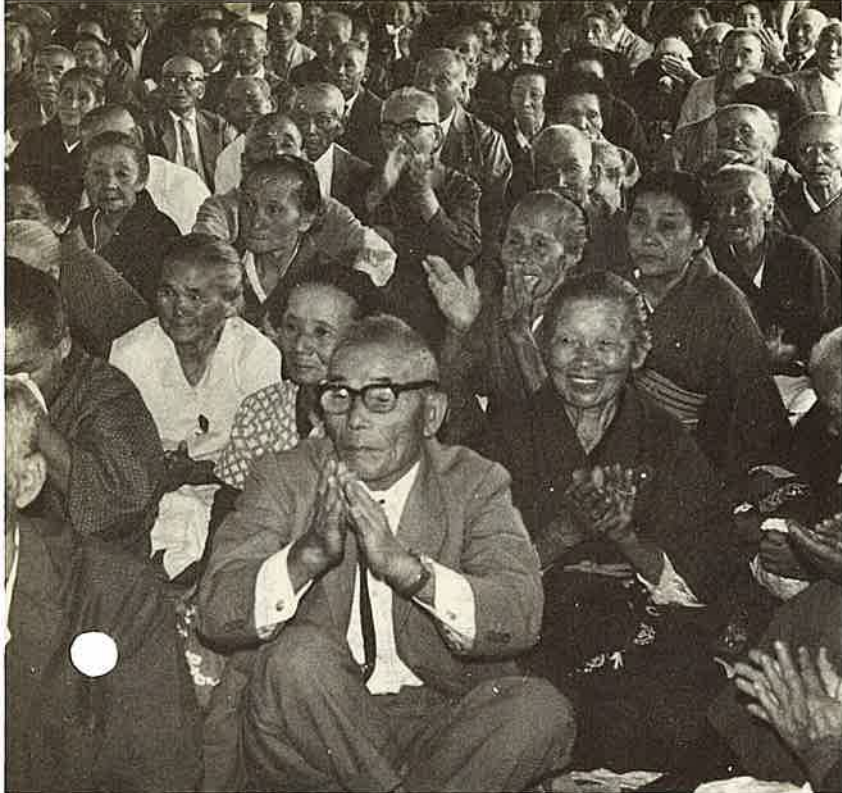
年はとってもこんなに元気です