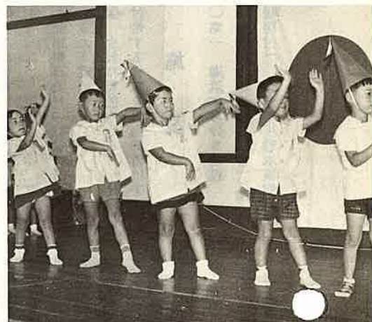
おとしりを慰めようと 一生けんめいに る保育園のこどもたち