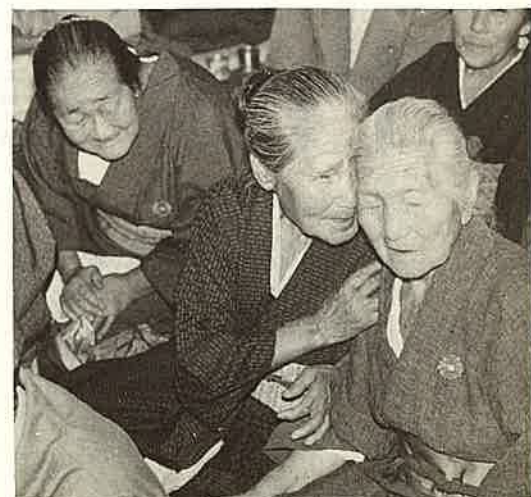
口と耳とを寄せ合って 世間話しに話しがは