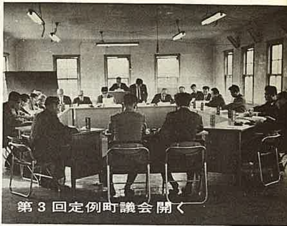
第3回定例町議会開く