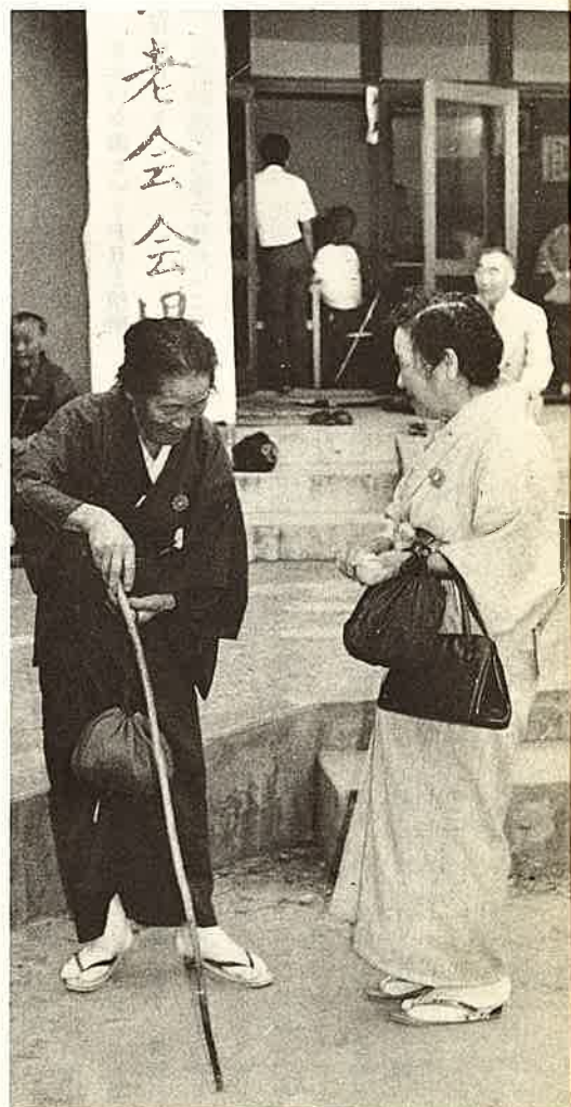
しばらくだね、おたがい長生きしましょうや!