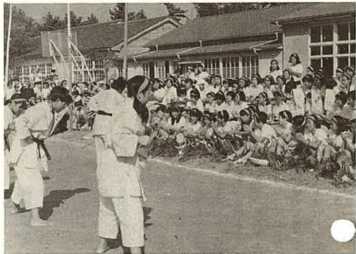
高校生の応援ぶり（家政高校体育祭で）