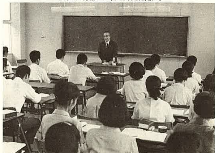
中堅社員の自覚をと講習にも熱がはいります

スポーツの秋もたけなわ。管内の保育園や小中学校、高等学校での運動会や、体育祭が行なわれ、澄んだ秋空に喚声や爆笑がわきあがりました。低学年ほど観衆の人氣が高く、真剣な態度の中になにかユーモラスな場面があり、みるひとを楽しませようです。