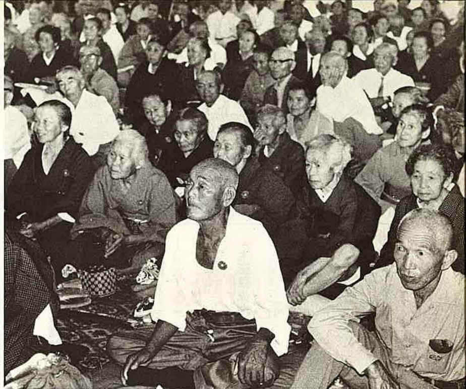
元気な体でいつまでも