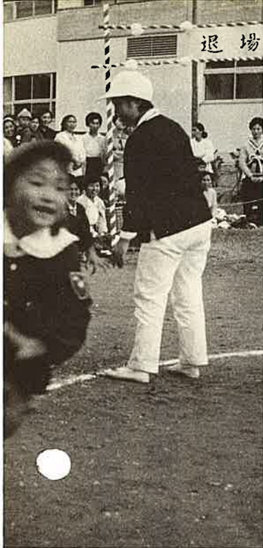
一番人気があつた保育園の運動会