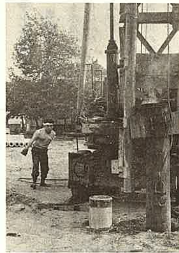
御宿小屋内体育館の建築工事

は二、三のグループに協力をお願いしてあります。家庭教育学級は御宿小と布施の婦人を対象として