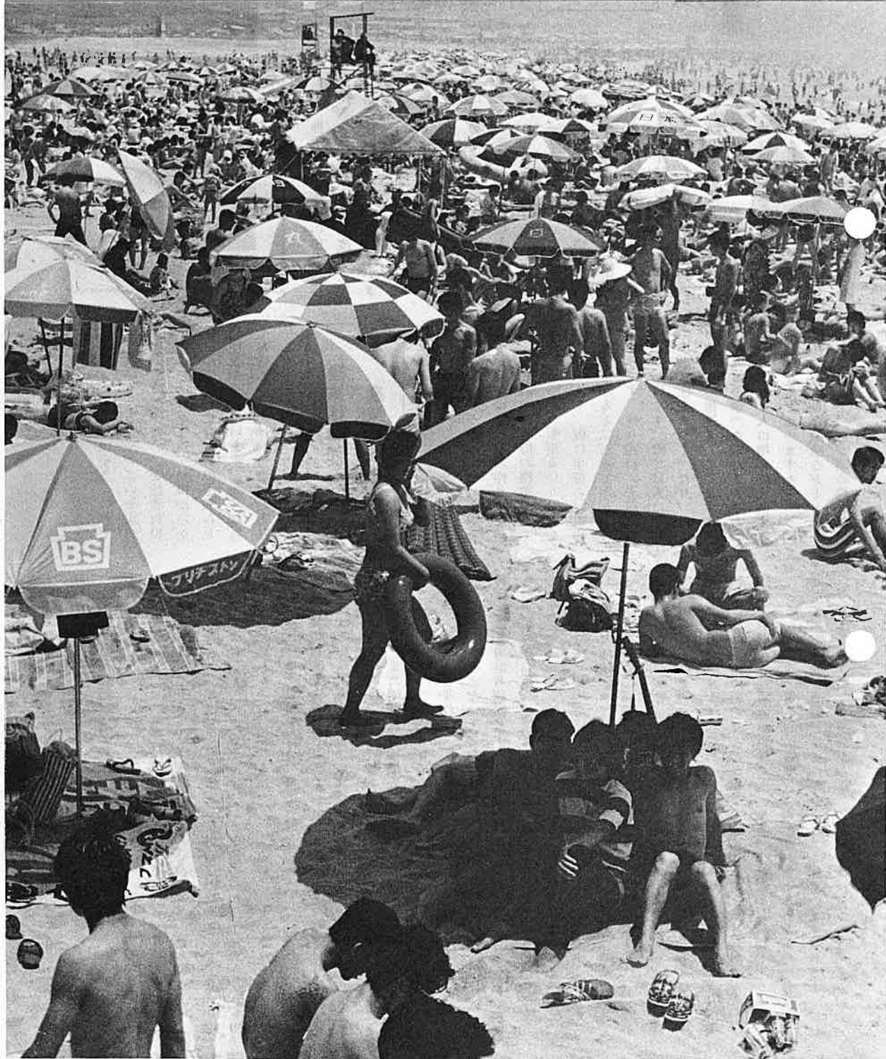
ことし120万人の人出でにぎわった海水浴場