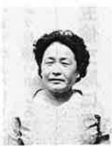
さる八月十五日の終戦の日に東京武道館で終戦二十五周年を記念して、全国戦没者追悼式が天皇皇后両陛下をお迎えして盛大に行なわれました。

から、パートタイマーの雇用は、ますます増加する傾向にあり、会社によっては、社会保険に加入さ