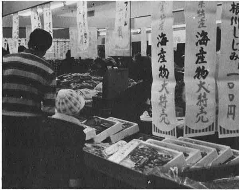
直売所の大特売で消費者の不満に答えられるというが……