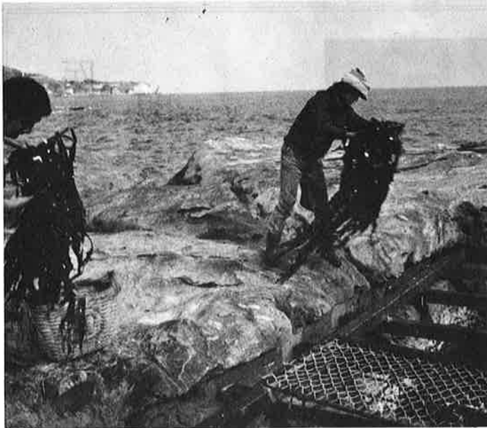
稚貝の好物、海草をふんだんにあたえ貝の成長をはやめる

間には、磯根管理の不徹底、稚貝の乱獲、海女(土)の熟練度および老齢化、民宿等の隆盛などがあげられるが、なんとといっても種苗放流事業の立遅れが、この格差を決定的なものにしたことは否定できない。いずれにしても種苗放流事業は移殖、放流したあわびが漁獲の対象となるには二ないし三年はかかることから、長期間続けて行なうことが望ましく、この事業効果は地道な追跡調査によって解明される。