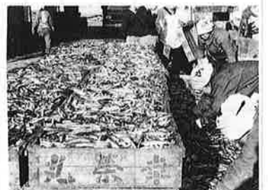
いわしがとれても夏の観光シーズンの需要はまかなえません