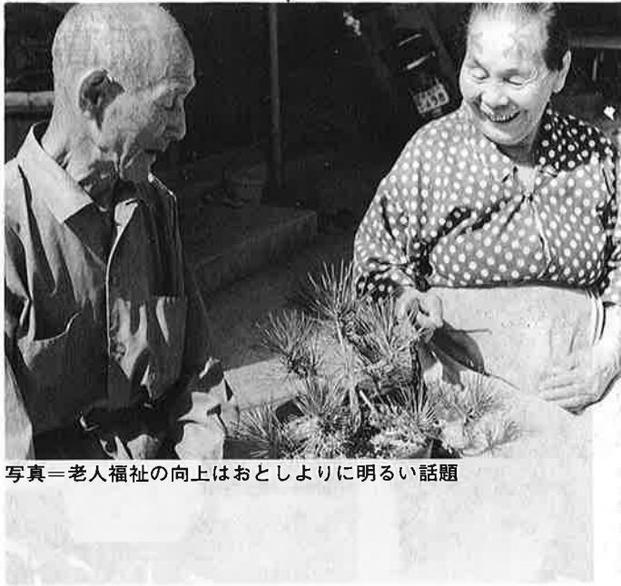
写真=老人福祉の向上はおとしよりに明るい話題

年金法の改正は夫婦五万円年金を骨子とした、拠出年金の水準の大幅な引き上げをし、物価スライド制の導入という点で、画期的な制度改正といえましょう。 (1)、拠出年金の十年年金は月額一万二千五百円に、五年年金は月額八千円に引き上げ。 (2)、保険料は(定額分)月額九百円とし、昭和五十年一月以後、段