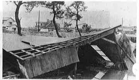
写真—天災は忘れたころにやってきます。ふだんから心の準備を