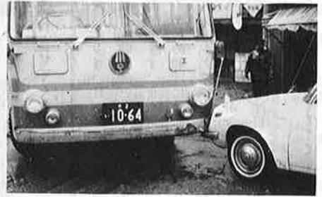
写真＝事故の事後処理は早く

交通事故による災害には、必ず損害賠償請求の問題が生じます。ところが、だれに対して、いくらかの損害金を請求したらよいかわからない場合、自動車の賠償責任保険金はどう