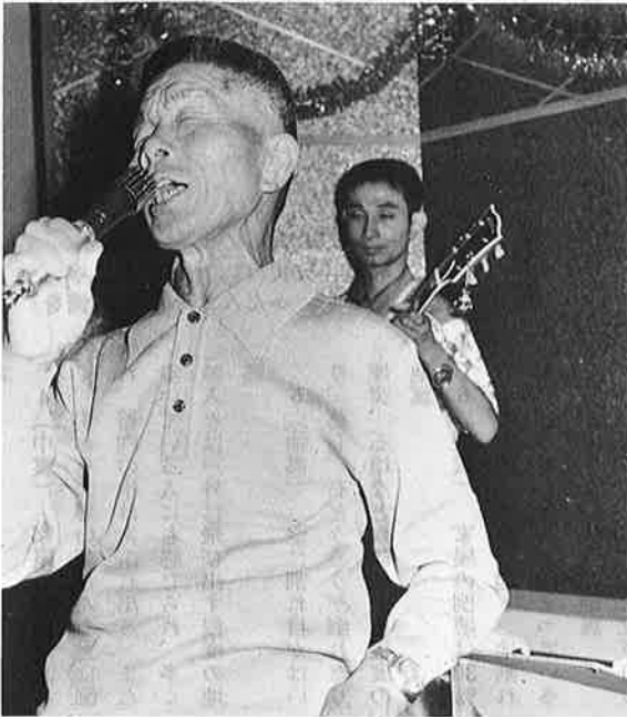
美声をはりあげ、曲った腰も伸ばして大熱演