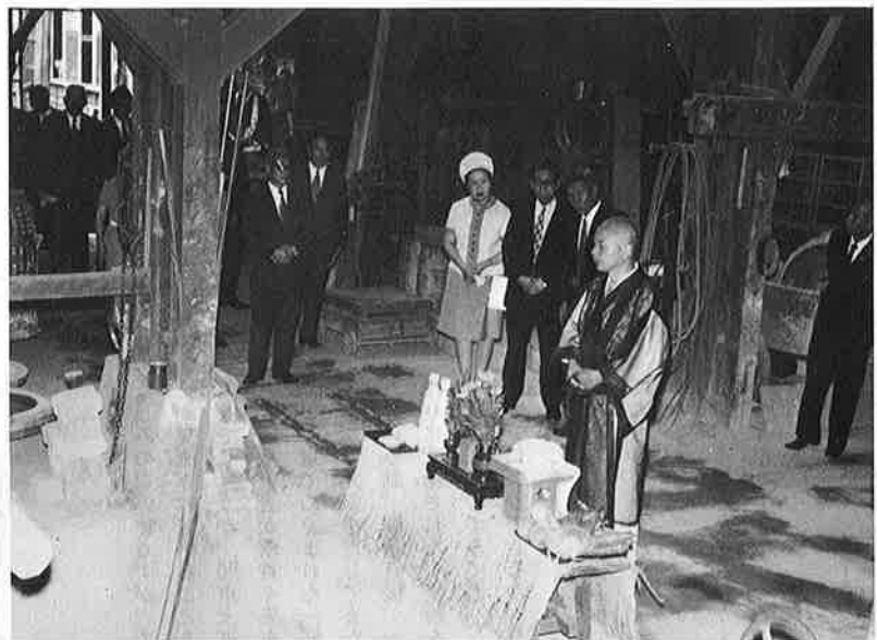
入魂の式にお立寄りになられた三笠宮殿下と同妃殿下。