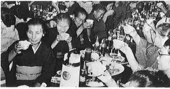
ますますじょうぶで長生きしましょう。健康を況して乾杯。

身動きができない盛会、つぎからつぎにくりひろげられる歌や踊りに歓声と笑いがとびかい、場内は熱気でいつぱい、ショーの最後は各区代表のど自慢大会でショーも最高潮、もうすつかり腰も、しわも、寿命も伸びたようす。