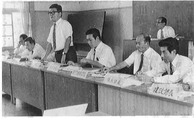
写真は熱心な質疑のやりとりがかわされる町議会