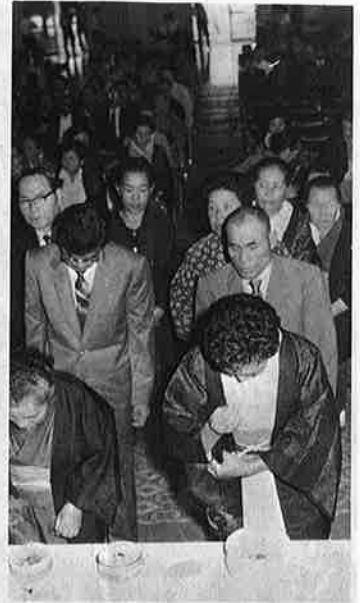
つぎつぎに焼香をするご遺族。