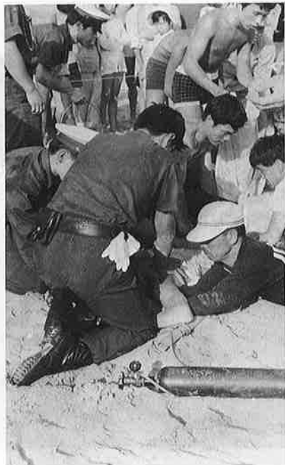
写真Ⅱ監視の強化で事故を未然に防ぐ

来遊者は、昨年とほぼ同じ百万台を確保したが、鉄道の電化により、日帰り客の増とマイカー族の大幅な増加が目についた。環境整備については、機械人力