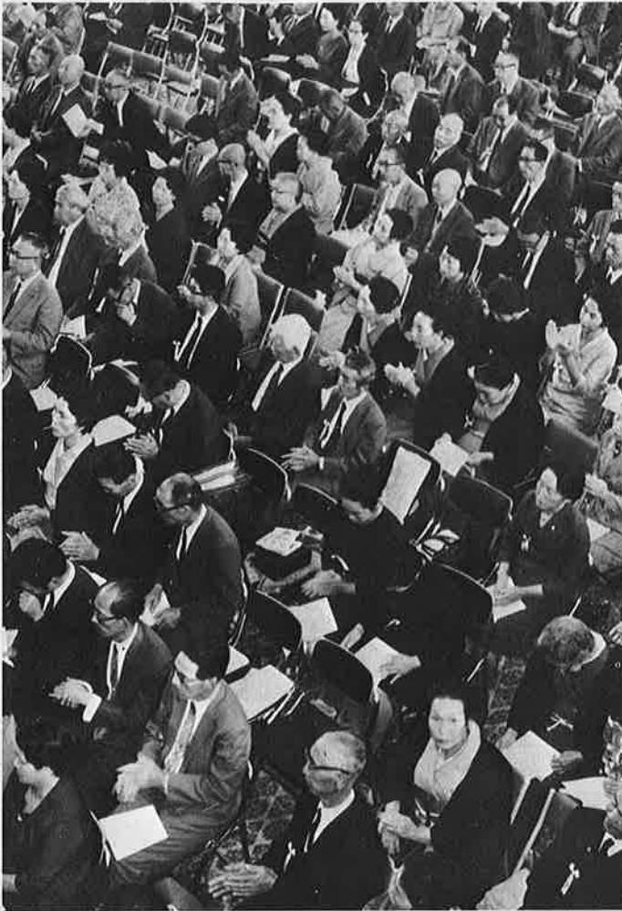
高齢人口の急増により老人福祉の充実が一段と望まれます。

福祉の年の敬老会。ことしは老人福祉法が制定されて十年目を迎えます。「健全で安らかな生活を保障される」と定められている同法をこの際あらためて、みんなで考えてみましょう。