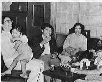
写真—夕食の後の一家だんらん

毎月の第三日曜日は、家庭の日です。明るく健康な家庭づくりは家族の団らん、語らい、ゲーム、作業、レクリエーションなどから生まれます。一家そろって楽しい夕べのひとつは、お子さまの話しや身近な話題からあたたかいた団らんをすましよう。