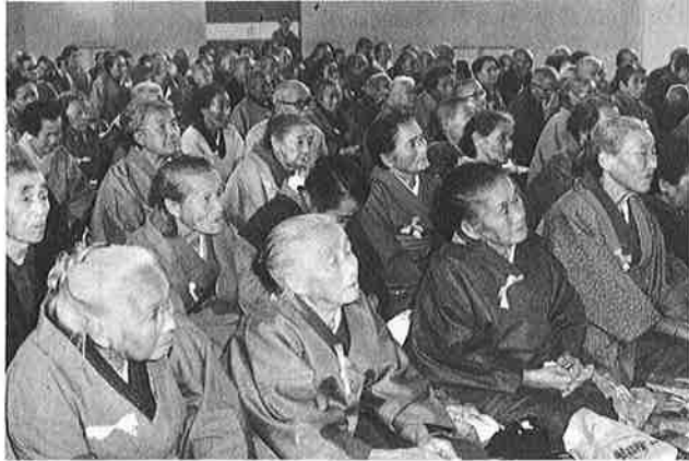
福祉年金をもっと充実させ 生きがいのある毎日を

母子世帯となったときに支給する年金 年額十一万七千六百円。（子どもが二人以上いるときは、二人目の子につき九千六百円。三人目からの子一人につき四千八百円加算）