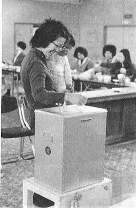
おかあさんも気軽に投票をしました