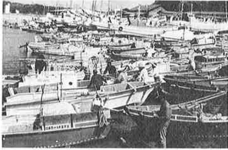
写真 狭い漁港解消のため漁港の拡張がつけられます。

災害復旧費は、農地農業用施設土木災害に五千九百二十二万四千円 消防費は、分団詰所、防火水そ