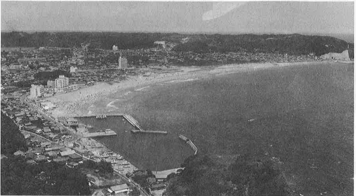
恵まれた御宿の環境を保ちながら60年の計画目標年次にはさらに発展が見込めます。

御宿町開発の基本構想は、昭和六十年における町の望ましい姿を実現するために策定されました。そしてこの計画を着実に実現するために、五年ごとの実施計画を作り、さまざまな施策を盛り込みました。実施五カ年計画は昭和四十八年度から昭和五十二年度を第一次として策定されました。