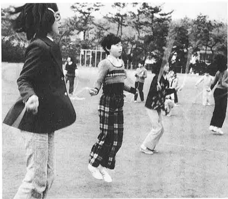
長時間縄飛びを競う、まだまだ足さばきも軽い