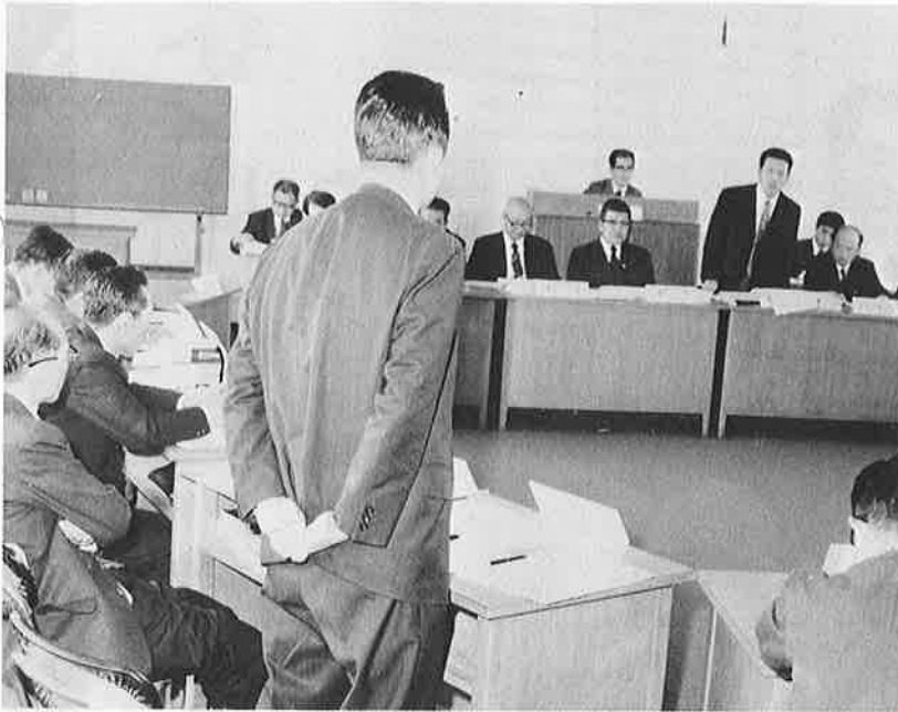
熱の入った予算質疑が交わされる3月議会

昭和五十一年御宿町議会第一回定例会は、三月八日に招集され、会期八日間（九日から十四日まで休会）実質二日間で、議案十五議案（うち一議会を追加上程）、二つの選挙の予定で審議に入りました。三月定例会は、新年度（五十一年度）の予算審議が中心議題となっています。