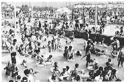
人気のある町営プールのにぎわい