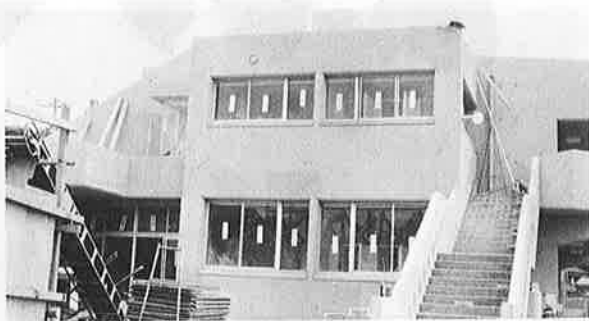
最後の仕上げを急ぐ、岩和田保育所

宿小学校のグラウンドに集まった会員たちは、耐久競技や学年対抗縄飛びで技を競いました。競技終了後に子ども会育成会のおかあさんたちから賞品をたくさんいただきました。