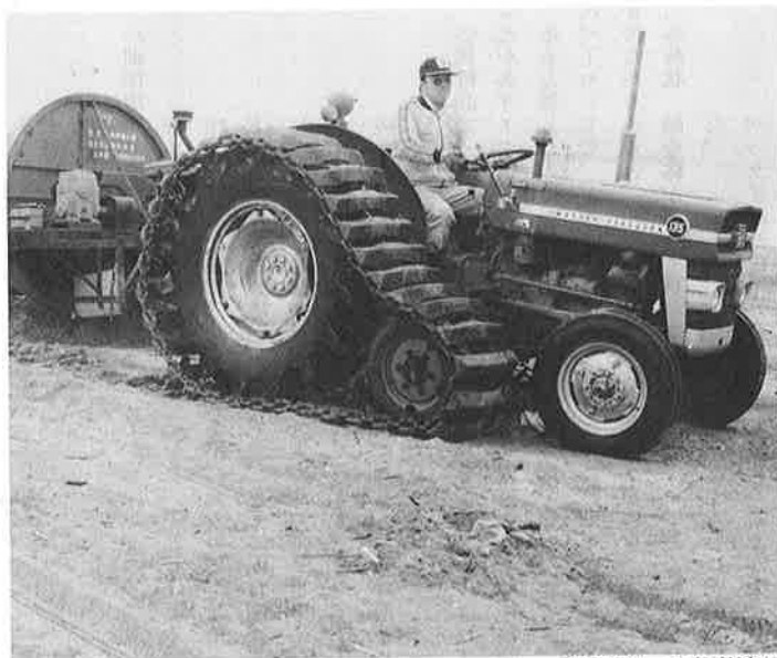
動きだした海岸清掃

わたしたちの町は観光地として ここ数年来急激に入込客が増加し ています。このようなお客を受け 入れる体制として、まず、恵まれ た自然を保護しなければなりません。 恵まれた自然は、豊かな人間 生活を築くうえで、われわれの心