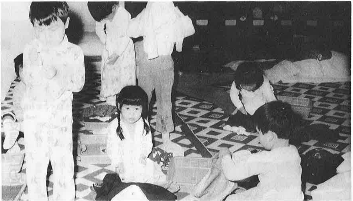
おひるねからさめて、自分で物をさる園児たち

保育園からの入園通知を受け取ったお母さんがたにとって入園前はあれもしたい、これも揃えたいと不安なことでしょう。そんなみなさんの参考のために入園前の準備として、どんなことに気をつけたらよいかなどをまとめてみました。