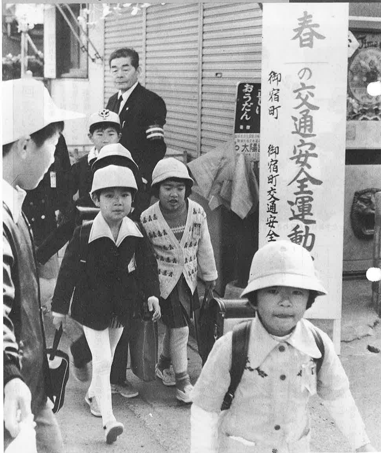
交通安全協会の指導員の街頭指導と上級生の通学の誘導に従い、緊張と喜びの表情で集団通学する新入生