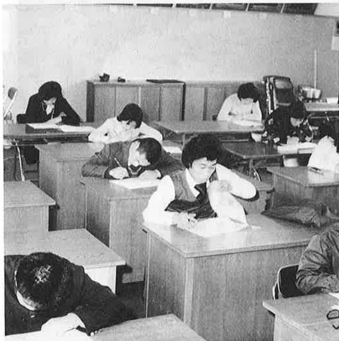
緊張し、答案用紙とにらめっこ

役場は、いつでも明るく、広く窓口をひろげ住民サービスに徹していますが、テストは大学受験以上の競争率とあって、この日はかりは役場の門は、狭く、重苦しいふんいきでした。