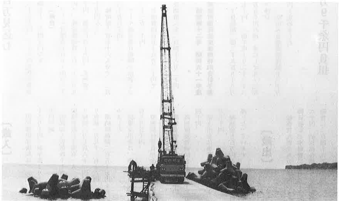
高々と積上げられた波よけのコンクリート壁(消波工)