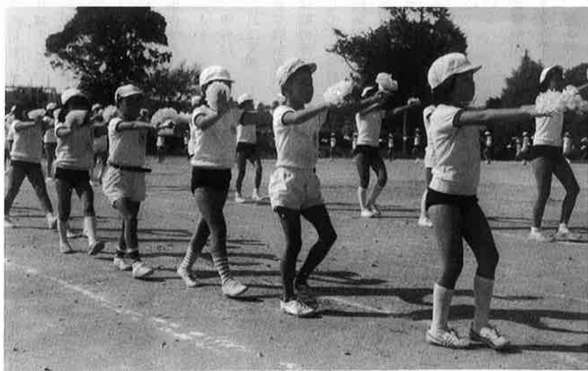
かわいい遊ぎに拍手のあらし(布施小)