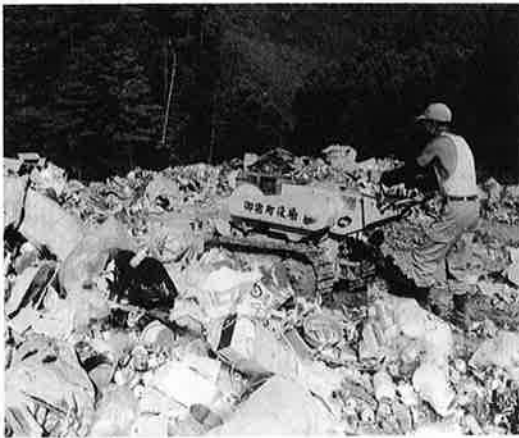
じんかい処理場はこんないっぱいに