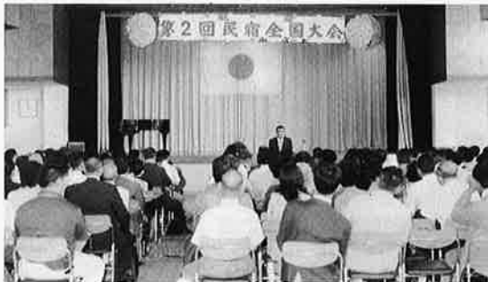
盛会だった民宿全国大会

とくに民宿に最も必要な人間味のある暖かさ、家庭のふんい気、心のふれあいなど。ともすると失いがちな、いまの世相に欠かせない史実として、語りつがれているメキシコ塔にまつわる話には、参加者が息をこらして聞き入っていたのが印象的でした。