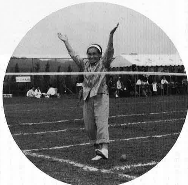
◇ターゲットリンピック◇㊦子どもにかえて みんな一生懸命㊧やったー！とつい"万才"