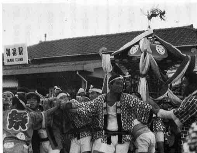
◇にぎやかに夏祭り◇さすが浜ッ子 威勢がいい㊨御宿地区㊩布施地区