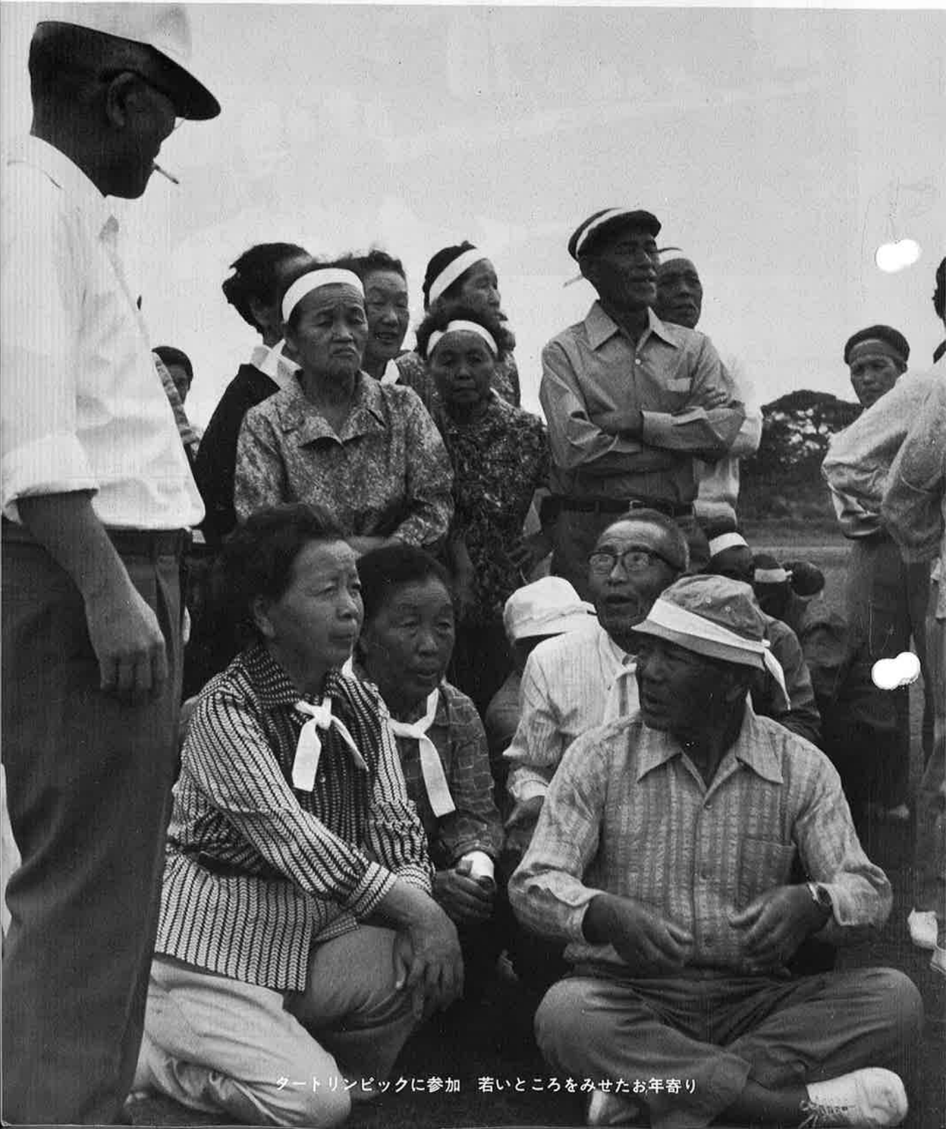
タートリンピックに参加 若いところをみせたお年寄り