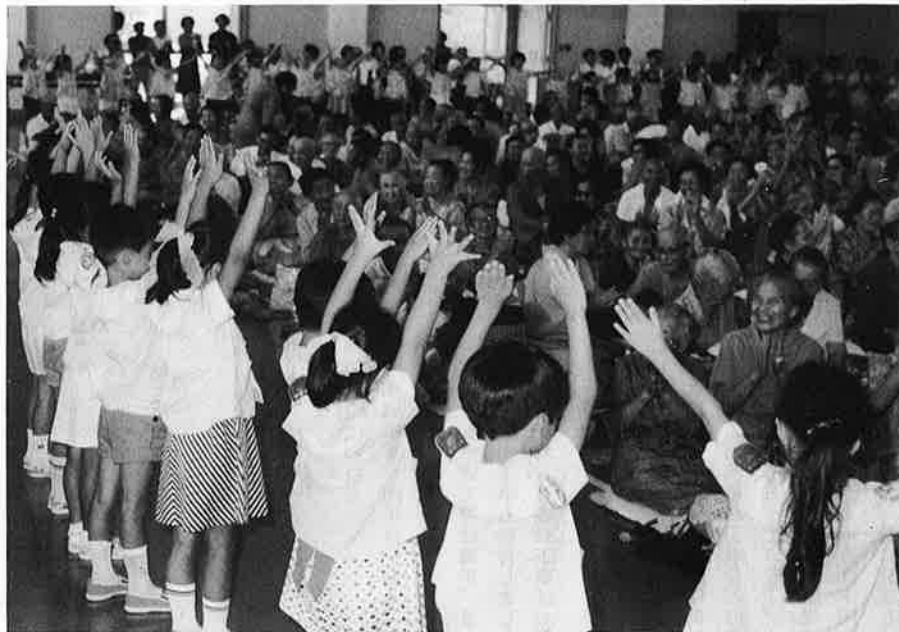
かわいい園児の遊びに大喜びのお年寄り