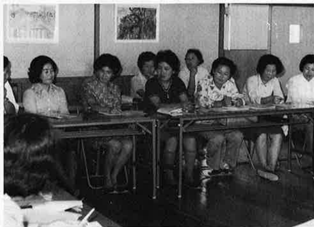
やはり子どものこと お母さん方は真剣

九月二十七日、御宿小学校で家庭教育学級が開かれました。この学級は、愛護会教育部が中心となり、郡教育委員会の協力を得て開設されたものです。