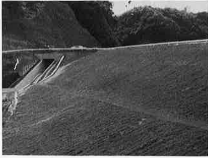
完成したダム築堤工事

前年度からの繰越工事(築堤工事)一億一千八百三十七万九千円についても一月三十一日に完工しまし