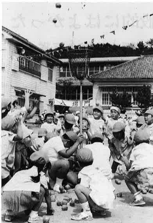
どの子も玉入れに一生懸命(岩和田保育園)