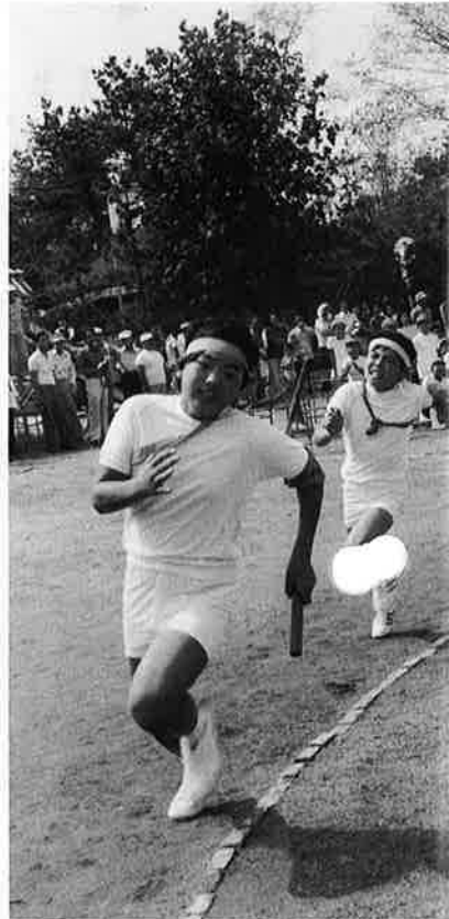
“もうすぐゴールだ、がんばれー”(御)