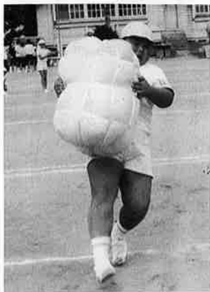
㊦こっちは早く早く ㊦ぼくは力持ち だぞ(岩和田小)