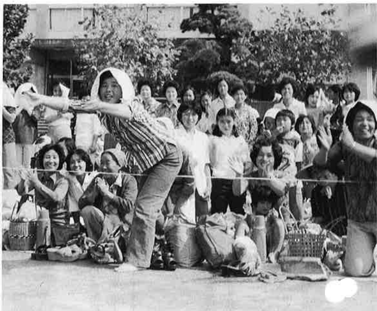
“がんばって”応援姿も勇ましい御宿小のお母さんたち