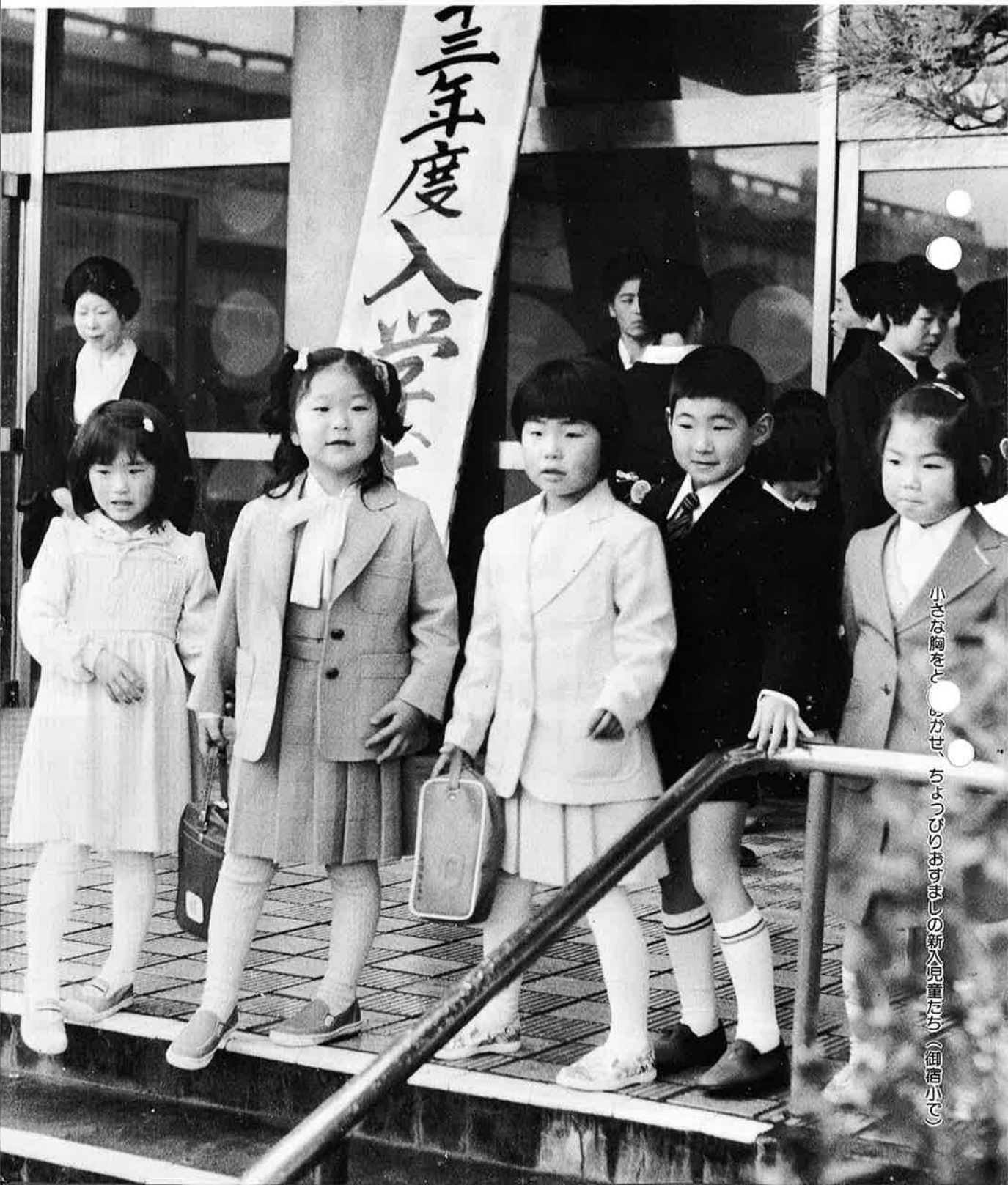
小さな胸をどきかせ、ちよびのびるおすまじの新入児童たち（御宿小で）