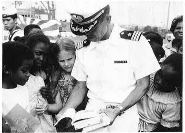
アメリカ・ボルチモアでの教科書交換