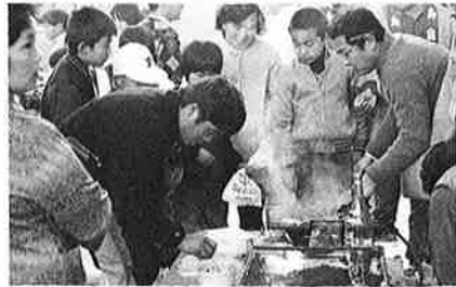
大にぎわいだった商業祭