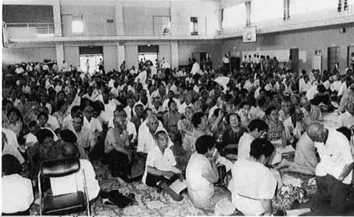
(上)盛大だった郡老人福祉大会 (下)傑作がずらりと並んだ作品展

七月二十四日、御宿小学校で第十六回老人福祉大会が開催されました。夷隅郡一万三千人の老人クラブ会員のうち、約七百名が参加しました。 当日は文芸作品展、芸能コンクール、小中学生による作文発