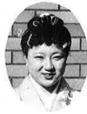
私たちは、昭和三十七年に生