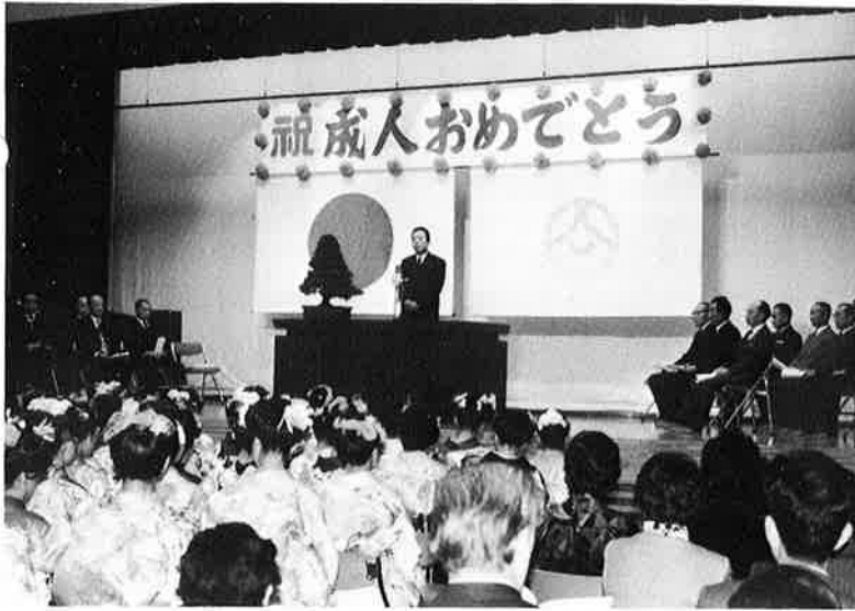
▲公民館で行われた成人式