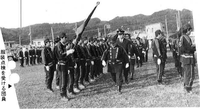
服装点検を受ける団員

例年行っているポンプ操法はグラウンドの状態が悪く中止しましたが、各分団の班長が行った小隊教練は好評を博した。また、県知事功労章などの表彰も行われました。受彰者の方は次のとおりです。(敬称略)