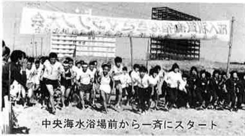
中央海水浴場前から一斉にスタート