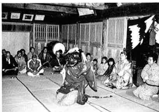
▲神楽の舞に合わせて手まり唄を歌う

一月十二日、高山田春日神社で恒例の初籠りの儀式が行われました。この初ごもりは、大ぜいで囃子を奏してお神楽を舞い、氏子中の安泰と網主の豊漁を祈る儀式で、以前は境内に夜店が出るなど賑やかに夜を徹したそうです。