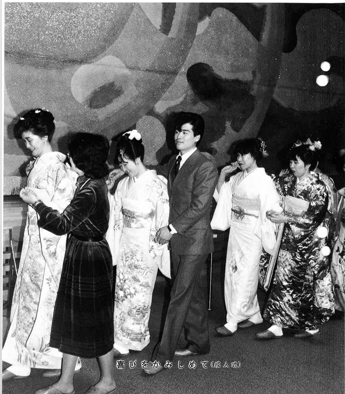
喜びをかみしめて(成人式)