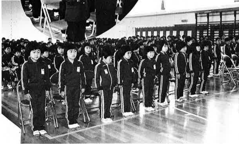
▲トレーニング・ウェアが似合います(布施小)