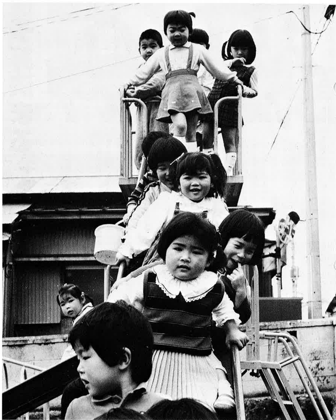
21世紀のホープさん(岩和田保育所にて)