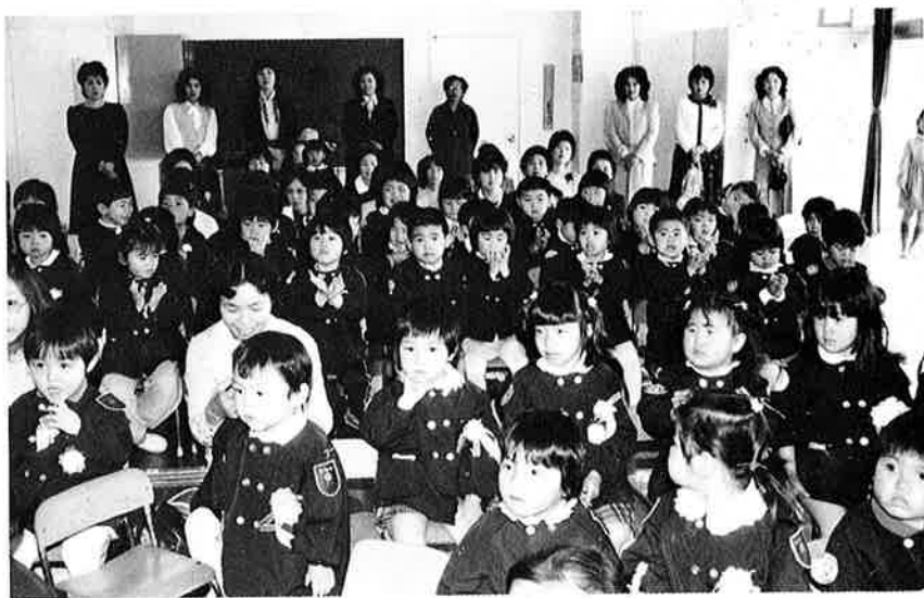
▲ 岩 和 田 保 育 所