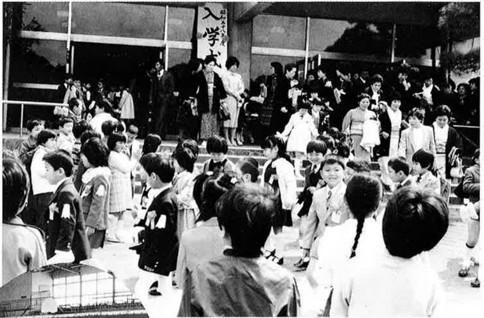
▲さあ、教室へ(御宿小)