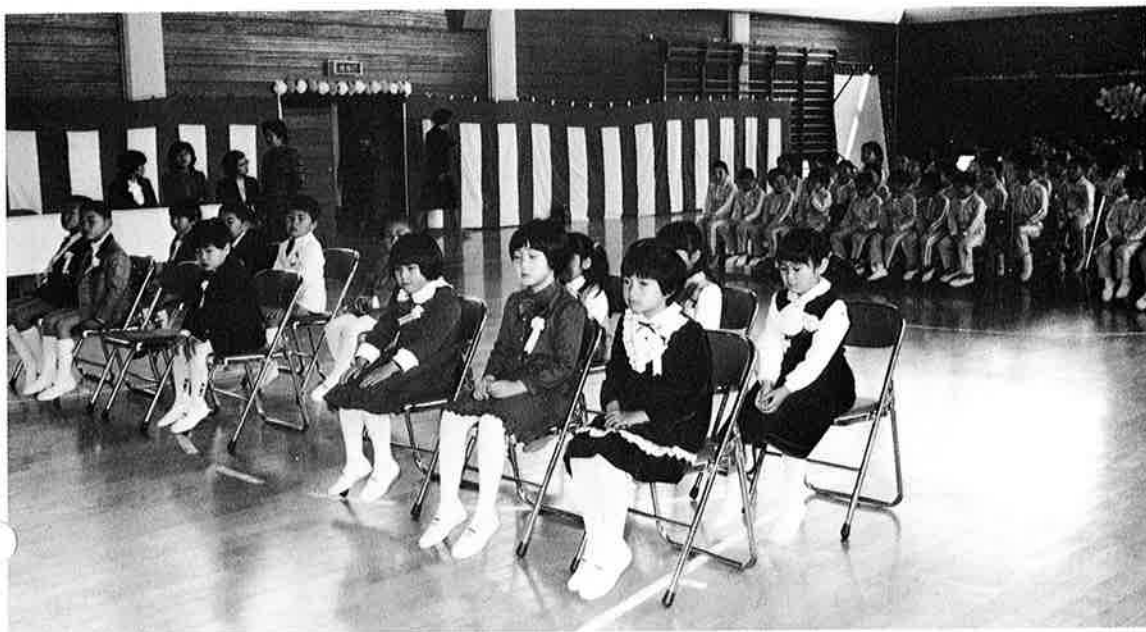
▲ 14 名 の 新 入 生 (岩 和 田 小)