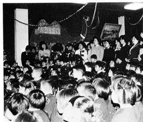
▲ 御 宿 保 育 所

四月は、入学式の季節。町内の各小・中学校では、やや大きめの制服を着た新入生が元気に覚えたばかりの校歌を歌い、学校生活のスタートをきりました。今年の新入生の数は、御宿中学校が百二十七名、御宿小学校が七十九名、岩和田小学校が十四名、布施小学校が三十三名となっています。