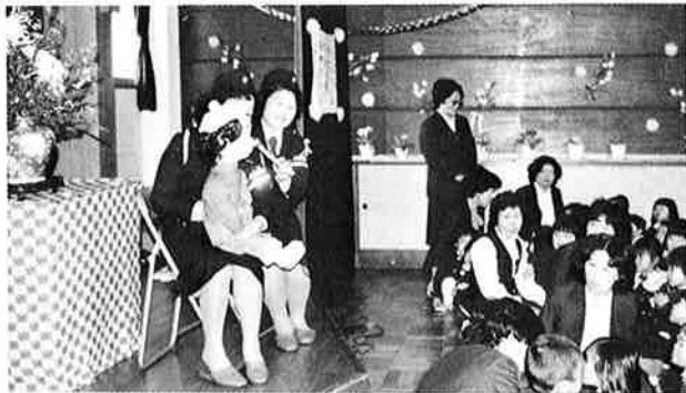
▲婦人指導員による交通安全のお話（御宿保育所）

「道でふざけてはダメよ」、「信号は青になって渡るのよ」くどいようでも愛の一声を!!