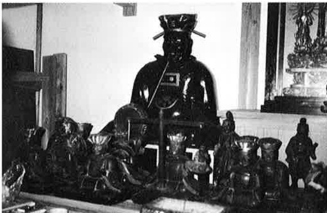
▲ 十王堂のえんま大王像

また、十王堂には、えんま大王像があり、江戸時代には毎年正月十六日と、七月十六日の年二回、ご開帳され、店がたち並び、近郷近在の参詣人でにぎわった、と『御宿郷浜村六軒町の十王堂、村の年中行事』に記されている。