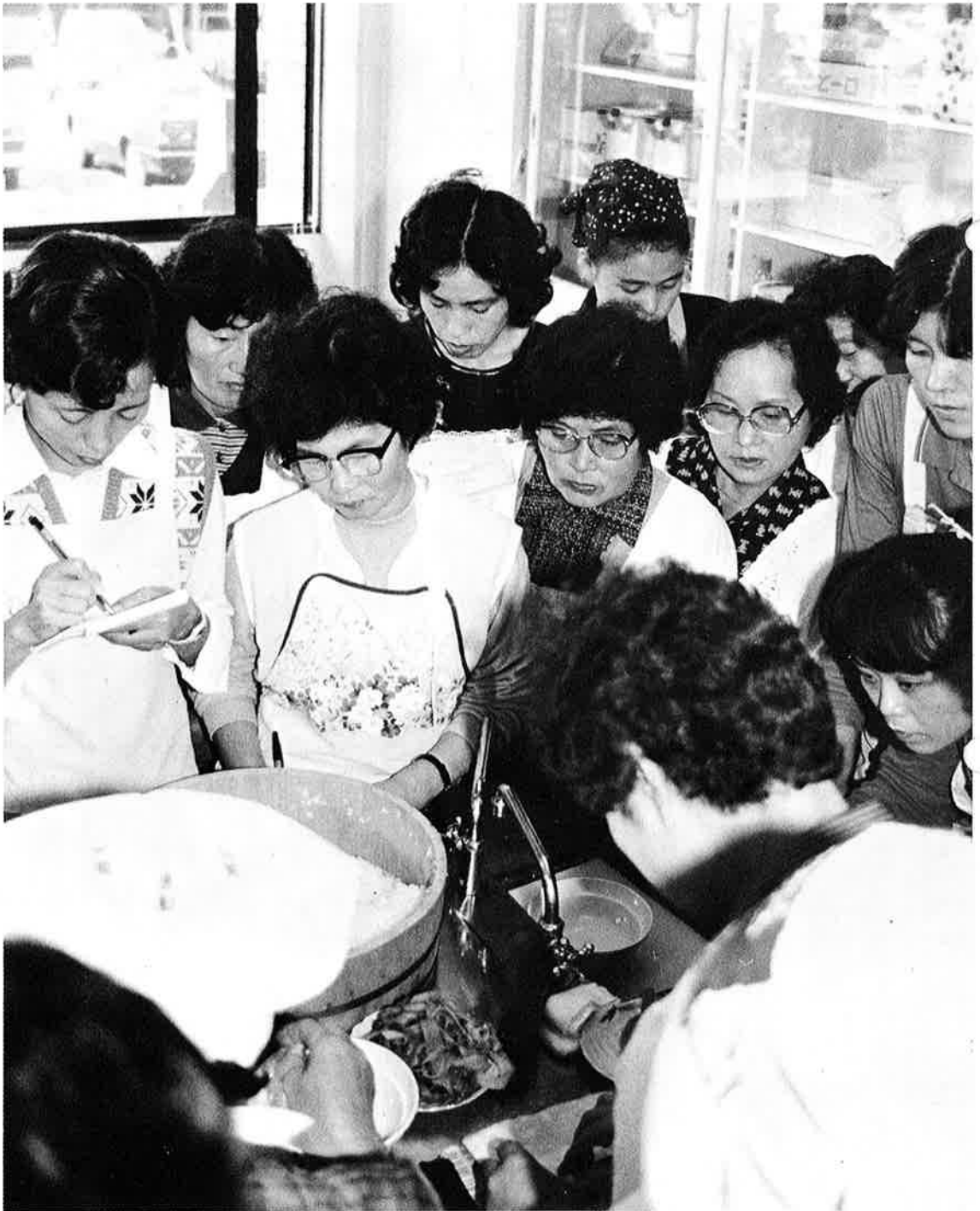
食欲の秋 料理講習は大盛況(婦人学級)