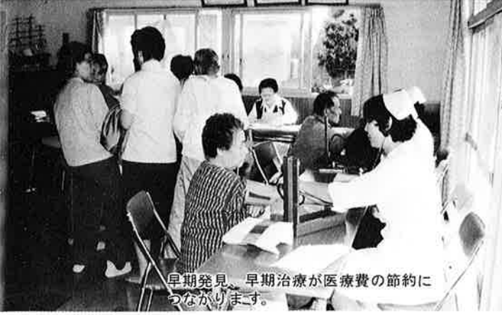
早期発見、早期治療が医療費の節約につながります。