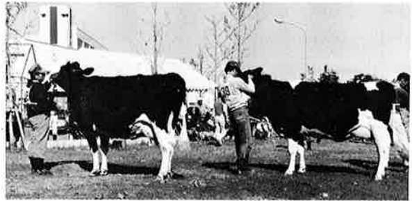
▲ 夷隅郡市の畜産振興を図る共進会

広がる過密と過疎 県の人口五百万……。初めて国勢調査が実施された大正九年（一九二〇年）の人口が、百三十三万人。二、三三年の間に、