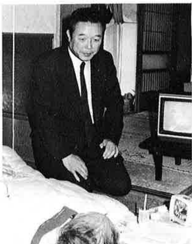
▲ねたきりのお年寄りを元気づける町長

内容は、現在月額「八千円」の支給額を、「九千二百五十円」とし、昭和五十八年四月一日から適用するものです。