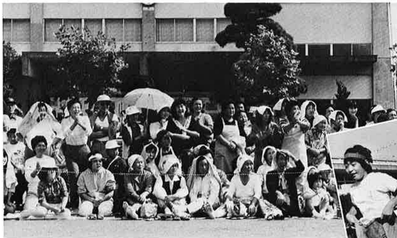
▲お天気も声援もとにかくアツかった