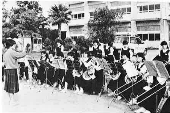
▲披露した御宿中ブラスバンド部 結成以来三カ月の特訓の成果を

合併三十周年記念と銘打った町民体育祭が、十月十日、御宿小学校校庭で開かれ、各区対抗リレーなどの二十七種目に保育園児から老人クラブのお年寄りまで幅広い年齢層が参加。汗ばむほどの青空のもとで、健康的な一日をすごしました。各区対抗の成績は、終盤に追い上げた岩和田区が優勝、二位新町区、三位須賀区の順となりました。