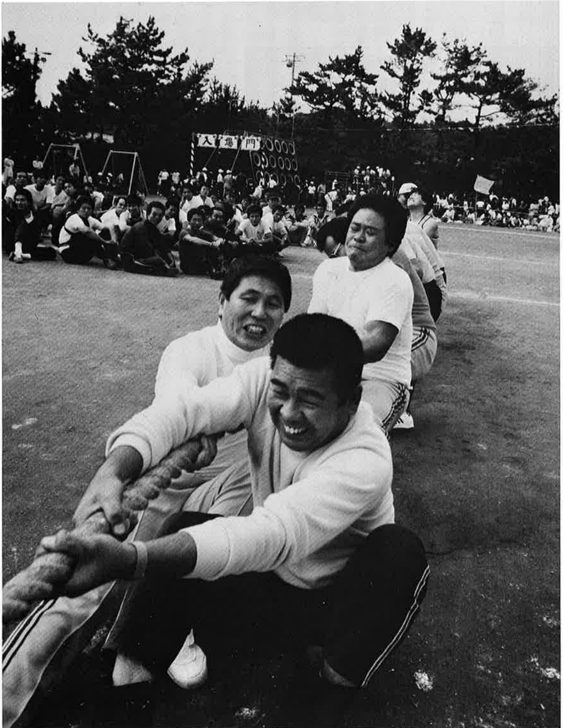
力が入ります 青团連つな引き選手権(町民体育祭)