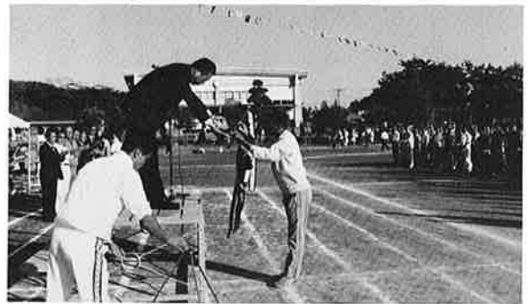
▲大優勝旗は岩和田区へ

秋立つや 三坪の烟の 忙しさ 梅干せし 庭に夜星を 見上げゐる 雲ひく、山越えてゆく 秋の風 鯛雲 寄せつ、岬や 月のぼる 湯上りの子を 追ひ廻す 天瓜粉 刈田焼く 煙り向ふに 声かけて 漁火の 息づく灯し 真夜の秋 空耳を 立て、遠くに 法師蟬 虫の音も 入れつ読経の 秋の夜 一枚の むしろに海女の 新さ、げ 朝鴉や 割りそこねたる 生玉子 吹き招く 尾花のみちを 誰か来る さんま焼く 猫も七輪 そばにゐる 病室の 一と日はじまる 鯛雲 一と刷けの 雲の動かぬ 花野かな 風がちの 浦路の虫の 淋しけり