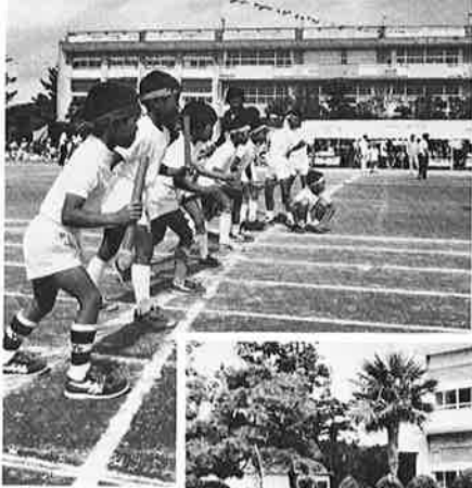
▲スタートが勝負 (学年別リレー)