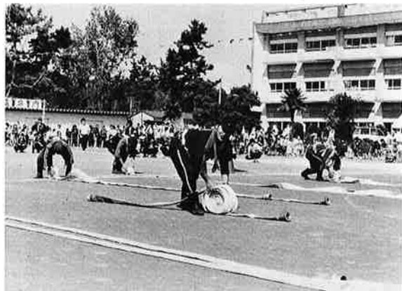
▲おちついて ゆっくりと (消防団ホース巻きリレー)