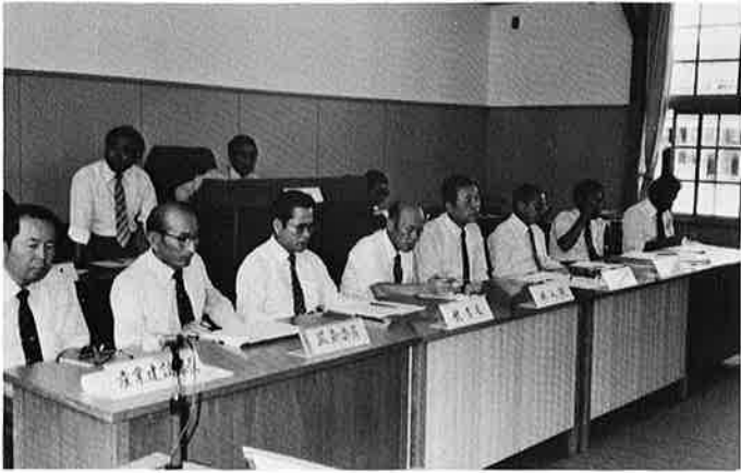
59年度決算をはじめ8議案が審議された

御宿町議会第三回定例会が、九月十八日招集され、五十九年度の各会計決算認定など八議案をいずれも原案どおり可決し、九月二十日閉会しました。