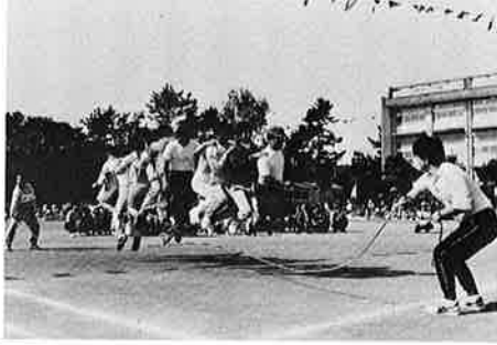
▲何回とべたかな (みんなでジャンプ)