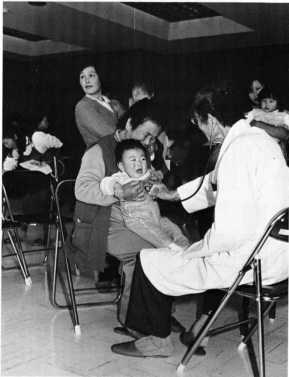
お気軽にご利用ください町の保健事業(1歳6ヵ月児健診)