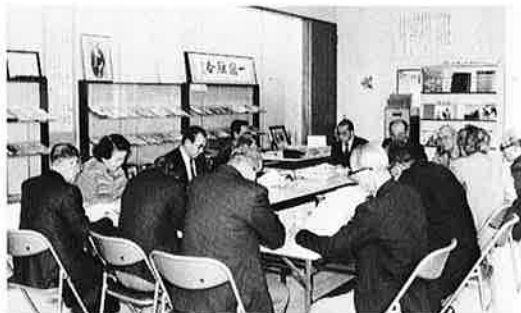
▲執筆内容を検討する町史編さん委員

六十一年になって町史編さん日程を作成し、現在その日程に従って、町史に記述する内容について、分担項目ごとに編さん委員全員で検討会を行っています。 町史完成目標は、昭和六十二年三月の予定ですが、町史執筆には、何よりも資料が必要ですので、古文書、古記録（江戸時代以降）を所蔵されている方は町史編さん事務局（資料館内窓4311）までご連絡くださいれば幸いです。