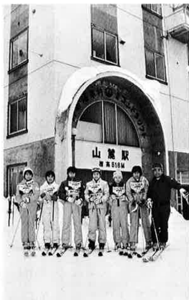
▲ 昨年の交流事業から

早朝マラソンに取り組んでいます。 走ることは苦しい。けれども彼らの胸の中は、間近にせまった野沢温泉村でのスキー教室、そして野沢温泉村の中学生との再会でいっぱいなのでしょう。 風邪やスキーでのねんご予防のために数年前から始められたこの早朝マラソン。二月三日からの交流事業を前に一段と活気がでてきました。