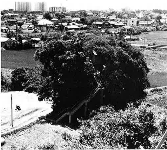
町指定文化財の帆柱の一部をまつる祠が建立された久保・北亀ノ越にある「三夜様」

われているサンフランシスコ号の帆柱が、町文化財の指定をうけたことから、これを伝承できると考えていました。多くの遭難者の霊をなぐさめる意味も含めて——