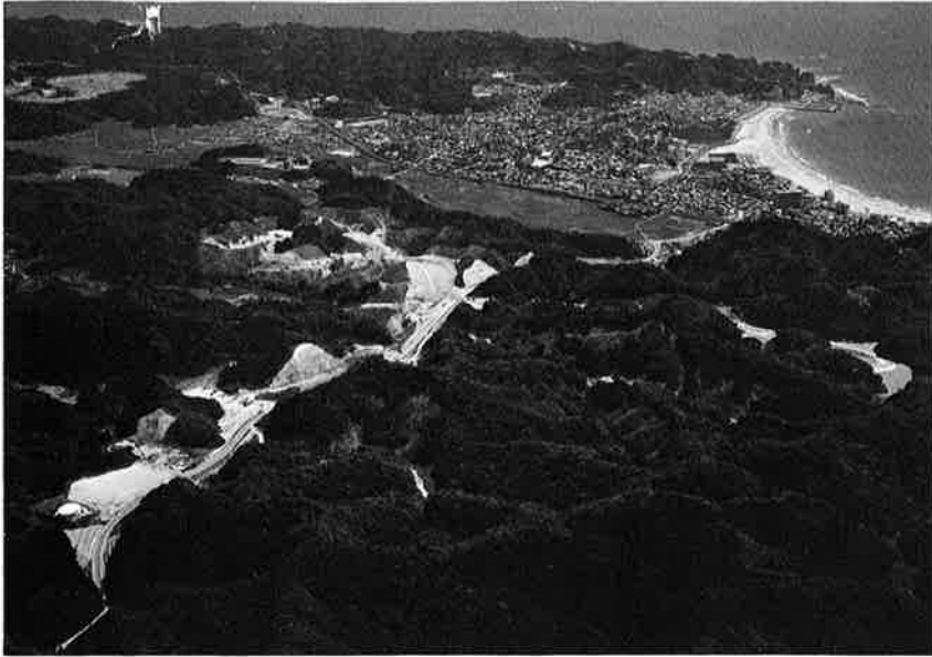
▲写真手前の山林170haにテニスコートなどのレクリエーション施設と一般住宅が建設される。(B地区上空から撮影)