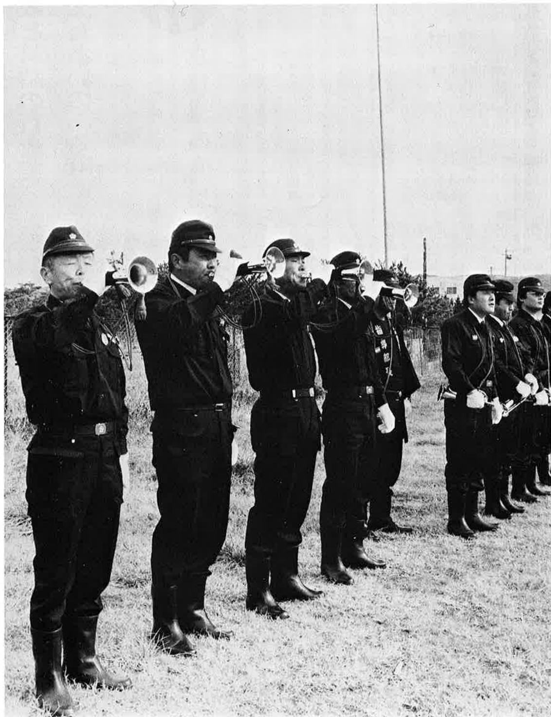
防災の誓いも新たに力強いラッパが鳴りひびく（出初め式）