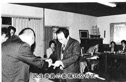
民生委員の委嘱状交付式

地域福祉を支える行政ボランティアのひとりである民生(児童)委員が、十一月末で任期満了となり、十二月一日付で次の方々に厚生大臣と県知事からの