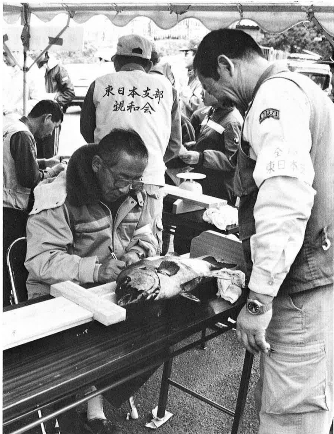
上々の釣り果に顔もほころぶ(御宿町磯釣り大会)