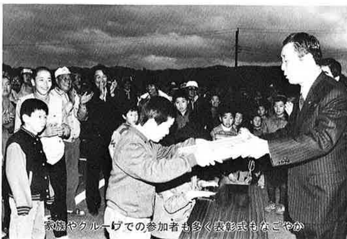
家族やグループでの参加者も多く表彰式もなごやか

十一月三十日、町及び町観光協会主催の御宿町磯釣り大会が開かれ、東京など遠来の参加者を含めた百八十二人が御宿海岸を中心に日の出を合図に釣り果を競い合いました。