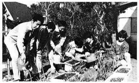
▲ 子どもたちも関心を持ってきた様子

「はるかに海の見える丘 月のしずくを吸って咲く 夢のお花の月見草 花咲く丘や、なつかしの」 幼い頃歌った童謡の一節を口 ずさみながら、黄色いふくよか な「待宵草」が一面に乱れ咲く 丘を頭に描きながら種まきをし たのは去る九月十七日のこと でした。 町の「月見草を咲かせる会」か ら、月見草の栽培をしてみない かと、たくさんの種子が届いた のは、たしか九月十六日のこと でした。届いた二種類の種子の