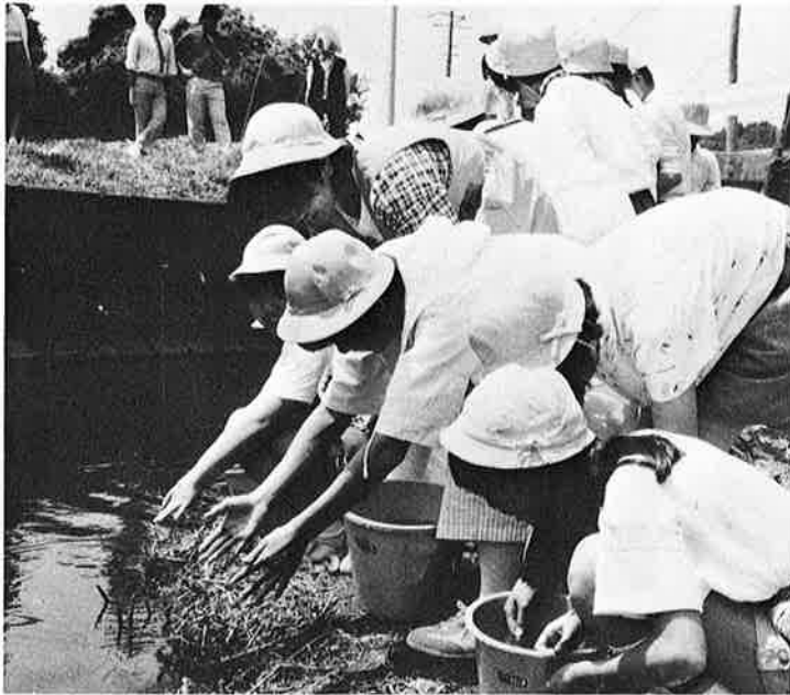
河川浄化の願いをこめて錦鯉を放流(61年6月)