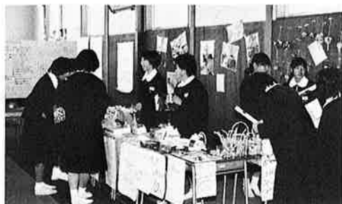
▲ バザー風景(学習成果発表会)

『学習成果発表会』にしても『合唱コンクール』にしても、学級単位で発表し、競い合わなければならないのだ。何よりもクラスの団結力がものを言う。 『学習成果発表会』——準備中、友だちと意見が合