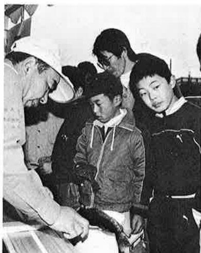
▲ 検査を受ける目は真剣

和気あいあいのうちに幕を閉じました。なお、各部門の入賞者(二位から五位)は表のとおりです。