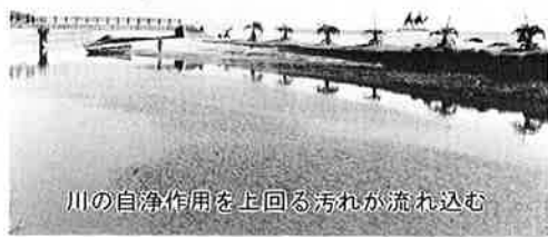
川の自浄作用を上回る汚れが流れ込む

環境係——いま三角コーナーの話が出ましたが、近々三角コーナー用の紙袋を町内のご家庭に十枚ほど配布して、使ってみる感想を聞くことを考えています。