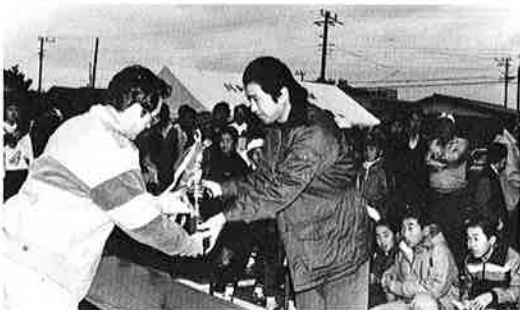
▼ 地元の入賞者も多かった

《お礼》磯釣り大会の開催にあたり、後援並びに協賛いただきました事業所・団体の皆様に厚くお礼申し上げます。