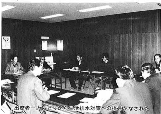
出席者一人ひとりから生活排水対策への提言がなされた

大谷——私は、実際に川が汚れていることを知らない人が多いのではないかと思っています。自動車ですっていると川を見たら危機意識を起こすような「川の汚染の写真展」などでPRし