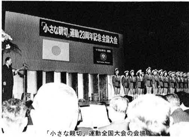
「小さな親切」運動全国大会の会場

十一月二十一日は東京・虎の門ホールで「小さな親切」運動二十三年周年記念全国大会のあった日です。当日からも約五十名の会員が参加し、幸い私もその中の一人に加えられ、盛大で意義深い会の空気にふれることができました。