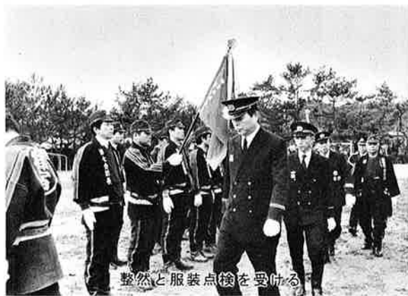
整然と服装点検を受付ける

地域防災を担う御宿町消防団の出初め式が、一月七日、御宿小学校校庭で行われました。