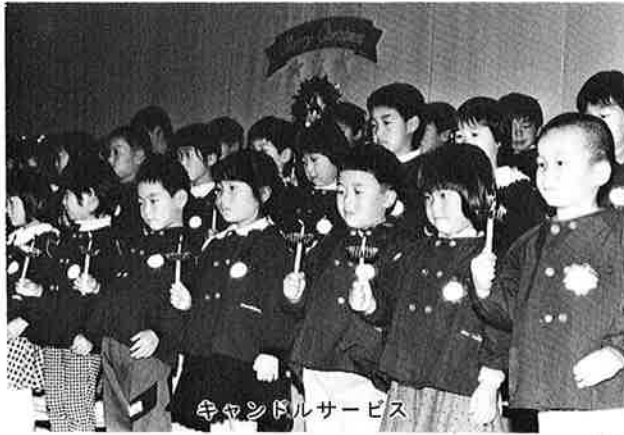
寺ヤシドルサービス