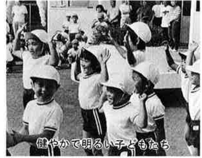
健やかに明るい子どもたち

児童手当制度は、児童を養育する人に児童手当を支給することによって、家庭生活の安定と児童の健全育成などを目的とするもの。