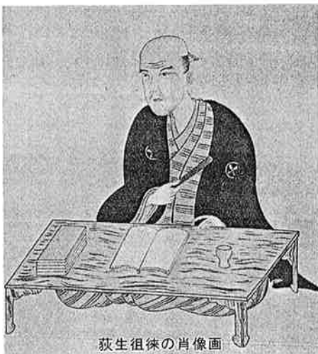
荻生徂徠の肖像画