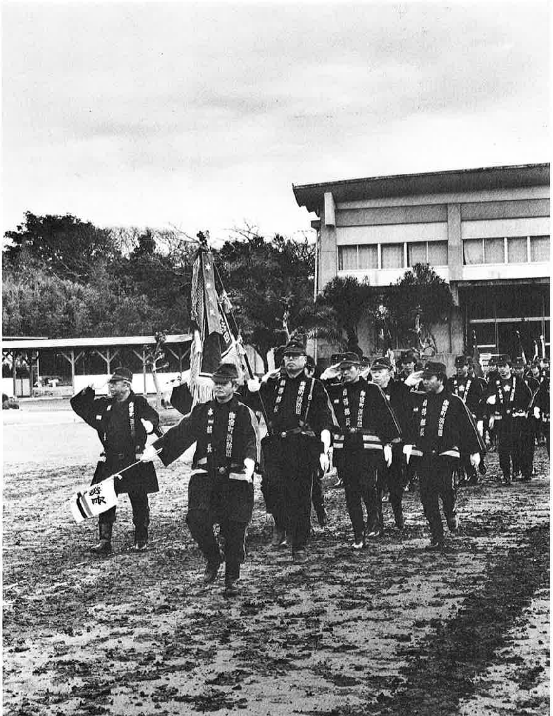
御宿町消防団の堂々たる分列行進(出初め式)