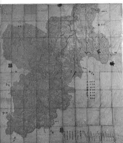
▲ 資料館に展示されている旧布施村絵図

の里、藤江藤江門道信で署名捺印がされている。また、この絵図が作成された年は「酉之年」とあり、その上の文字は紙が破