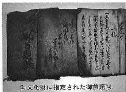
町文化財に指定された御首題帳

旅の日数、費用のほかに当時の旅の困難さを思うと、それを克服しての千ヶ寺詣りは江戸時代の庶民がいかに仏教に帰依していたか、その信仰心がいかに深かったかを知る貴重な民俗資料である。