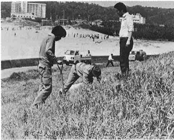
育てた人、移植する人、みんながボランティア

これは、昨年秋、「月見草を咲かせる会」がみなさんのご協力で各家庭に配った月見草の種が、芽を出し、移植に適する時期を迎えたため、その苗の一部を提供していただき、町内二カ所に植えたものです。移植した場所は、駅前通りのヤシの根もとと「月見草育成ゾ