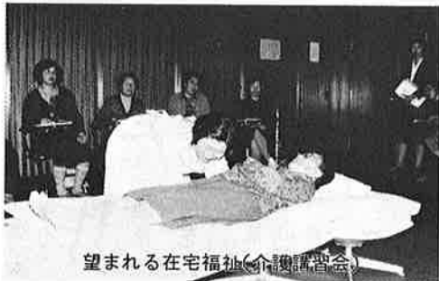
望まれる在宅福祉（介護講習会）