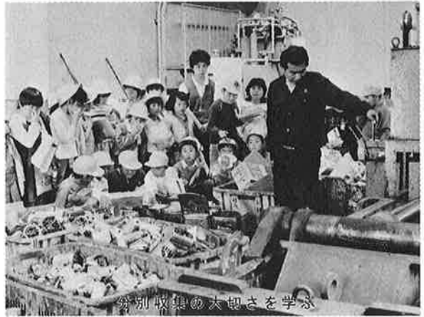
分別収集の大切さを学ぶ

御宿小学校の四年生が、社会科の時間に、町の清掃センターを見学しました。これは、町の仕事を学習し、そこに住む人たちの役割や地域社会の仕組みなどを考える目的で行われたものです。 清掃センターを訪れた子どもたちは、各家庭から集められたゴミが、どのような方法で処理されるのか、熱心に職員の説明を受け、学校へ帰り感想をまとめました。 子どもたちが見て感じた町のゴミ処理の仕事は、どんなだったのでしょうか。感想文を紹介しましょう。