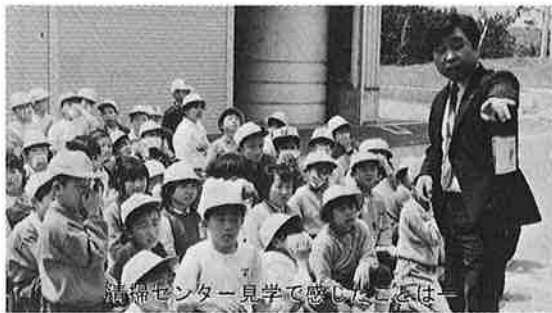
清そうセンター見学で感じたことは

わたしはゴミの勉強をするまで、ゴミをどんなふうにしてしまっているのかわりませんでした。四月二十三日に清そうセンターを見学して、おどろいたことやびっくりしたことがいっぱいありました。今までいろいろな社会科見学があったけど、せいそうセンターが一番すごかったです。多分ずっとわすれられないと思います。