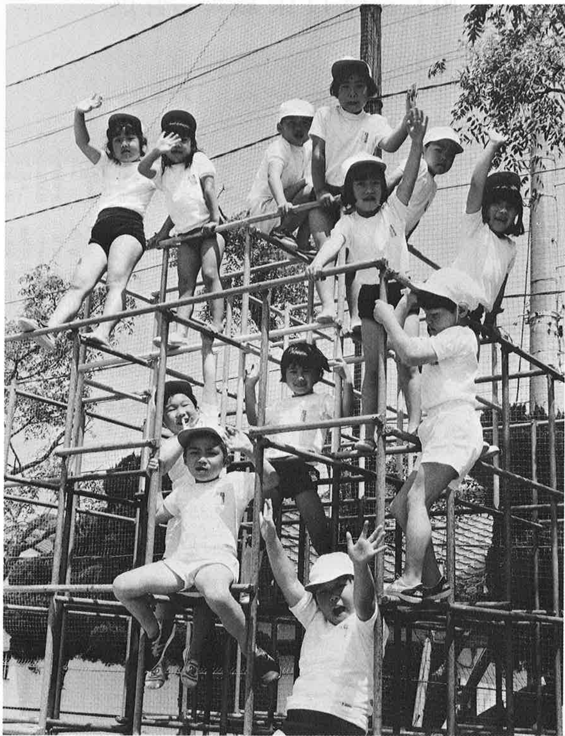
「ぼくら一年、元気がいいぞ」(岩和田小学校)