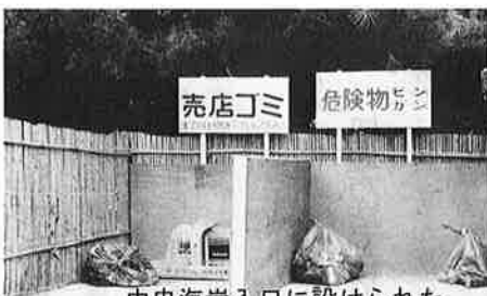
中央海岸入口に設けられた海岸ゴミの集積所

このように、いま御宿の海岸は、みなさんの気持がゴミのない海岸づくりに集中されています。(環境衛生課)