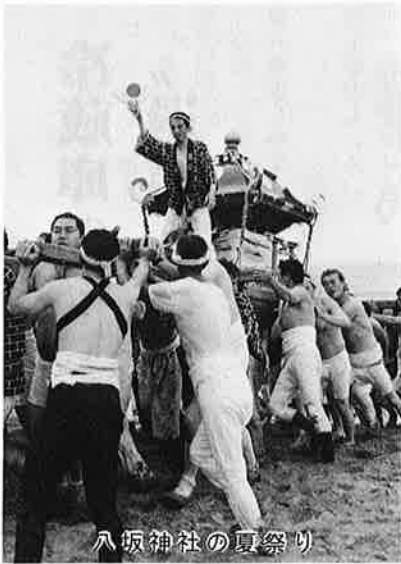
八坂神社の夏祭り