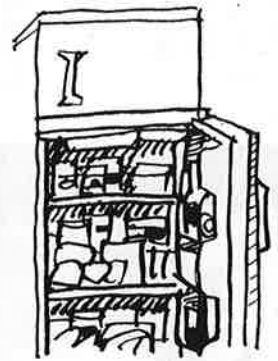
ドアの開閉は素早く

を開けて考えている間に、細菌は、じわりじわりと活動をはじめているかもしれません。そのためにも、ドアの開閉はできるだけ回数を減らし、開けている時間も短くしましょう。