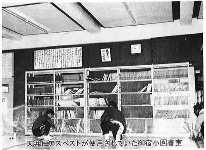
天井にアスベストが使用されていた御宿小図書室

御宿小学校校舎の天井の一部と同校体育館に使用されている石綿（アスベスト）——この石綿が肺がんなどを引き起こす危険な物質であるとの指摘を受け、町では早急な対策を練っていました。六月定例町議会に、千六百十六万円のアスベスト除去工事を提出。議会の議決を得て、夏休み期間中に工事を行うことになりました。