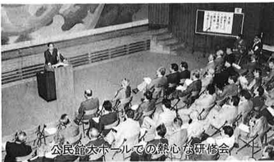
公民館六ホールの熱心な研修会

主な内容は、御宿小学校特別教室などに使用されている石綿（アスベスト）の除去工事費と、新町・六軒町字赤樽地先の公図訂正委託費などです。