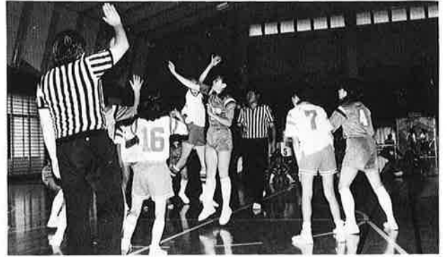
ジメジメした天候を吹きとばす元気いっぱい のプレーが続く

七月十七日、町青少年相談員連絡協議会主催の「青少年つどい大会」が行われました。この大会は、スポーツを通じて青少年の健全育成を図る目的で毎年開催され、子ども会対抗で男子はソフトボール、女子はミニバスケットボールの試合を行うもの。当日は、小雨が降るあいにくのコンディションでしたが、参加した子どもたちは元気いっぱいプレーをしました。その結果、ソフト、ミニバスともに岩和田子ども会が優