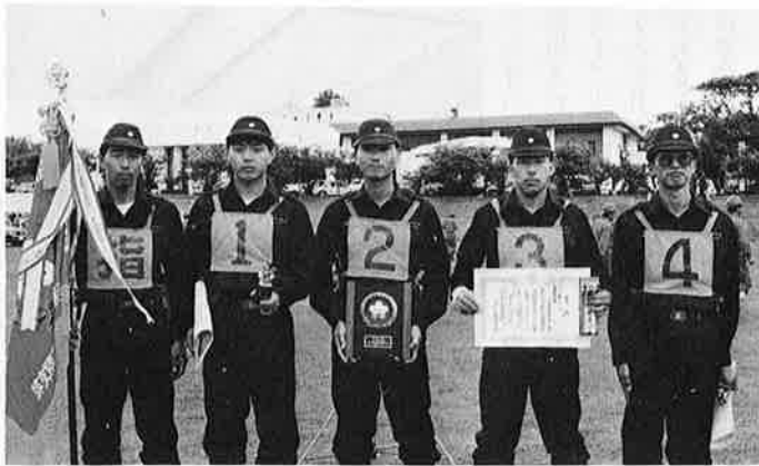
ポンプ自動車の部で最優秀賞に輝いた 新町・第2分団の出場選手

地域防災を担う消防団員の 日頃の訓練成果を競う第二十 一回夷隅支部消防操法大会が、 七月一日、岬町営運動場で開 催されました。