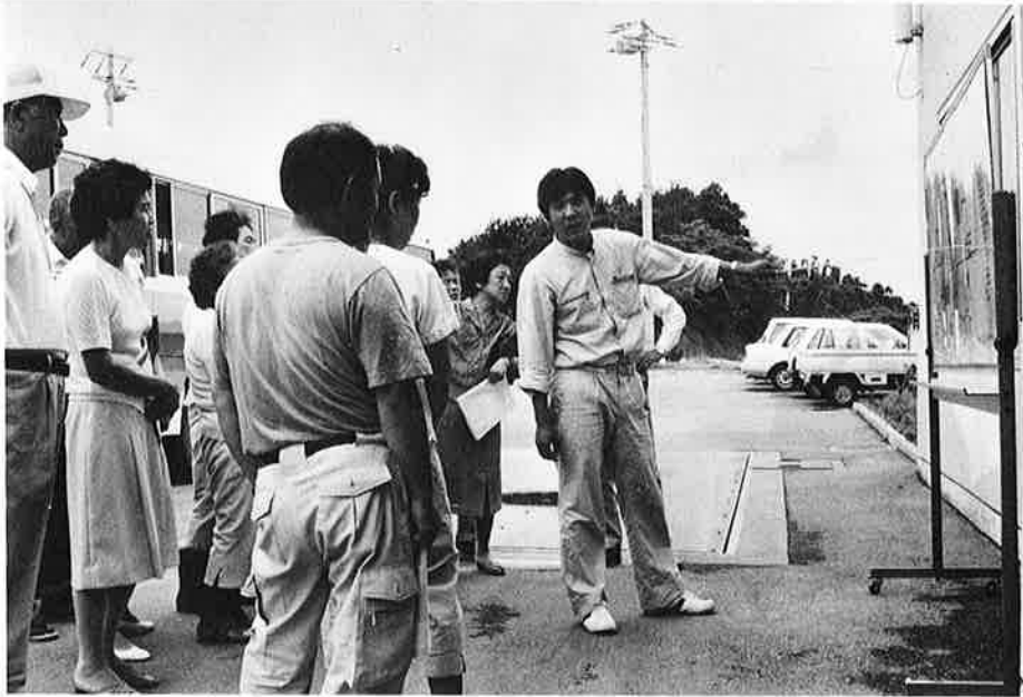
清掃センター見学前に、ゴミ処理の仕組みについての説明を聞く参加したみなさん。