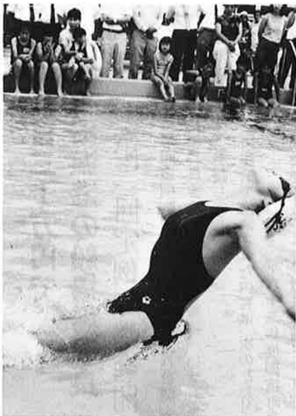
一流選手の力強い泳ぎにプー ルサイドの子どもたちも感激