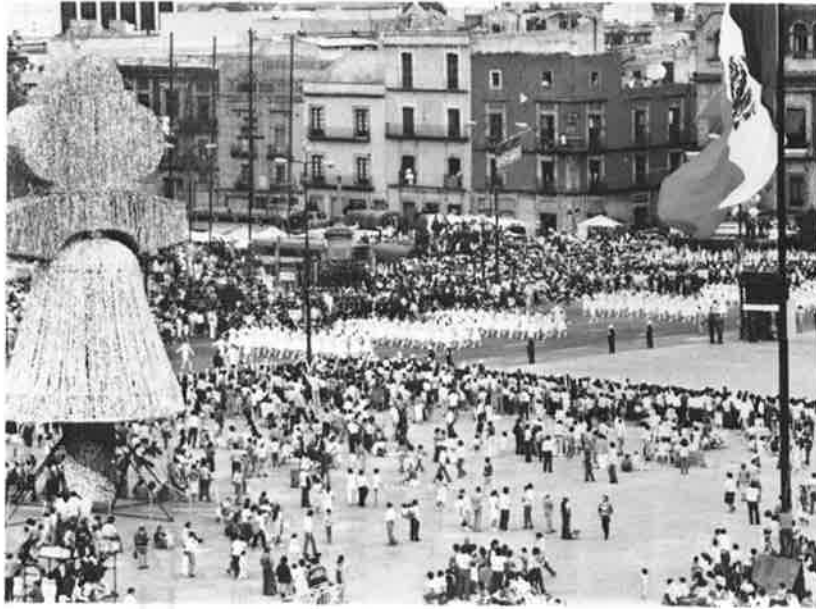
ソカロ広場を中心に繰り広げられた独立記念祭大パレード

前夜祭には、十数万人もの 人々が、ソカロ広場に集まり 独立の喜びを分かちあう。 広場に出ると、いきなりす