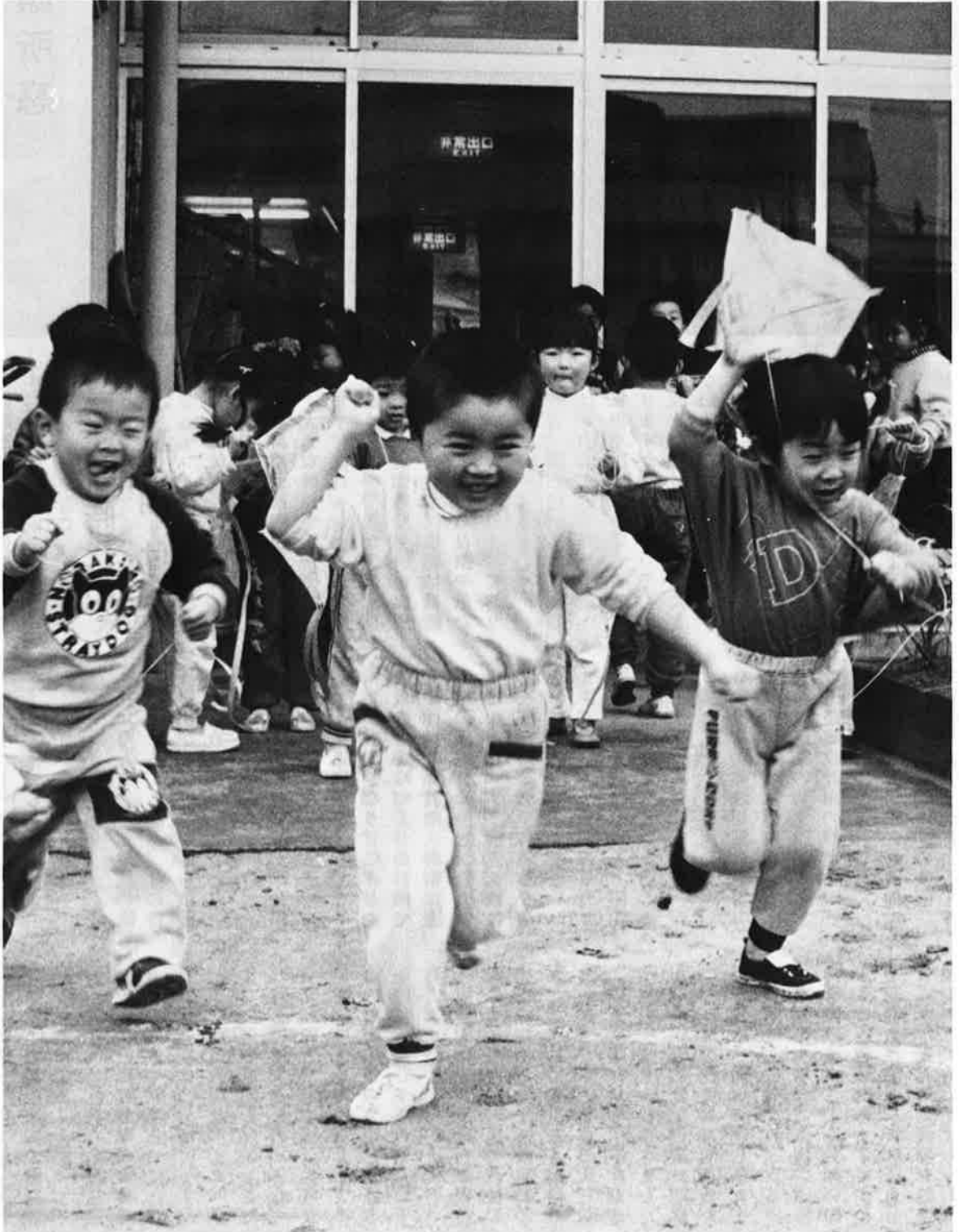
天まで上がれ、ぼくらの凧上げ（岩和田保育所で）