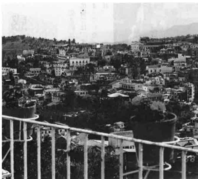
輝く太陽、柿色のレンガと白壁とのコントラストが 美しい「銀の町」タスコ

そして高さ四十六メートルの月の ピラミッド。当時、これらを 造った労働力は……想像を絶