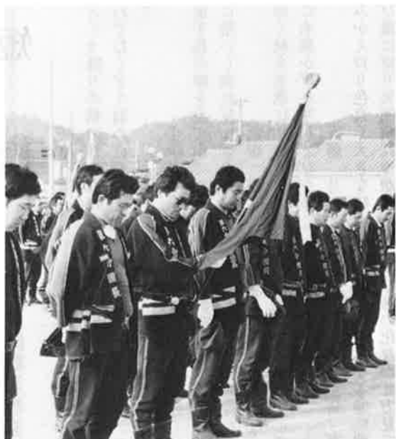
天皇陛下の崩御に哀悼の意を表し、全員が黙とうをささげる。