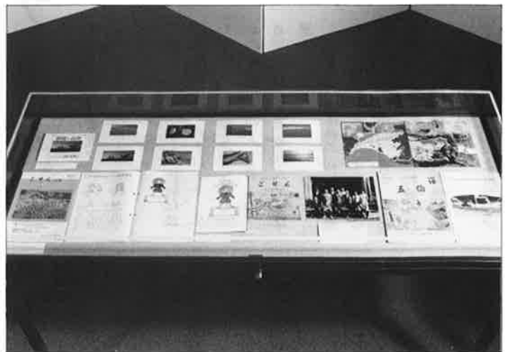
ボウボウアタマ博物館(シュトロウベルピーター博物館)内に設けられた五倫文庫と御宿町を紹介するコーナー。五倫文庫が出版した本とともに御宿町のカラー写真なども展示されています。

この絵物語は本にまとめられ『ボウボウアタマ』という名称で出版されました。この本は、面白さだけでなく教育的にも良い本であったので、ドイツのほかにも、英語、フランス語、ロシア語など各国語に訳され、現在では一千余版、十万余冊もあり、世界で読まれています。