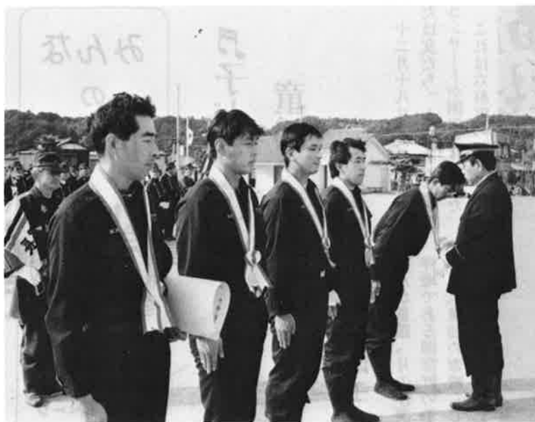
町消防団として初めて県消防操法大会に優勝した第2分団の出場団員に記念のメダルが贈られました

に全員が一分間の黙とうをさされた後、分列行進など一部の行事を中止。ポンプ操法や消防功労者の表彰などは予定どおり行われました。