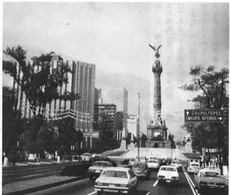
首都メキシコシティの街並

翌朝、興奮さめやらぬソカ ロ広場に、独立記念祭大パレ ードが延々と続いた。陸軍、 海軍、空軍と国を挙げての一 大行事は、市内を縦横に進行 し、メキシコ国民の喝采を浴 びていた。