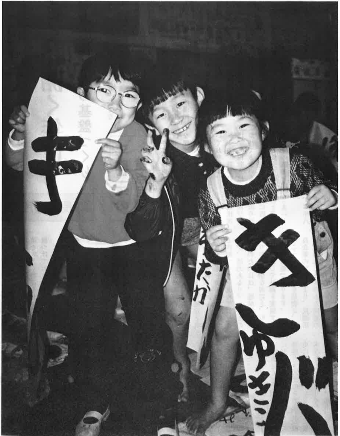
今年も明るく、元気いっぱい —— 書初めに挑戦した一年生