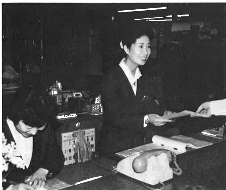
第2、第4土曜日が閉庁となっても、出生届や死亡届は、従来どおり、日直者が受け付けします

千葉県では平成元年四月から実施しており、県内の全市町村も平成二年四月までには土曜閉庁を実施する予定です。