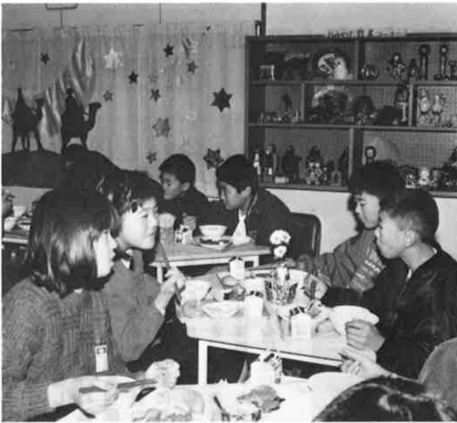
専用の食器、テーブル、壁面の飾りつけなど 教室とは違った明るい雰囲気のランチルーム

明るい雰囲気、おいしい給食を—御宿小学校では空き教室を利用して、給食専用のランチルームを開設、クラス単位で楽しい食事時間を過ごしています。 児童からのアイデアを取り入れ、お母さん方や先生方も協力してきた手作りの校内レストラン。「ランチルームで食べる日が待ち遠しい」との児童の声に代表されるように、ひと味違う給食活動が始まりました。