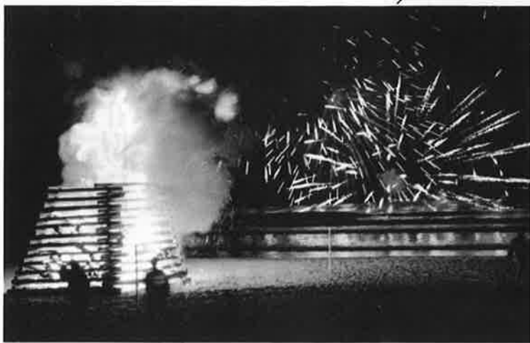
大たいまつと水中花火が渚を赤々と染める

の火祭りが、十二月三十一日、御宿海岸で行われました。若者の手で、高さ四があまりの大たいまつ九基に点火されると、燃え上がる炎が、赤