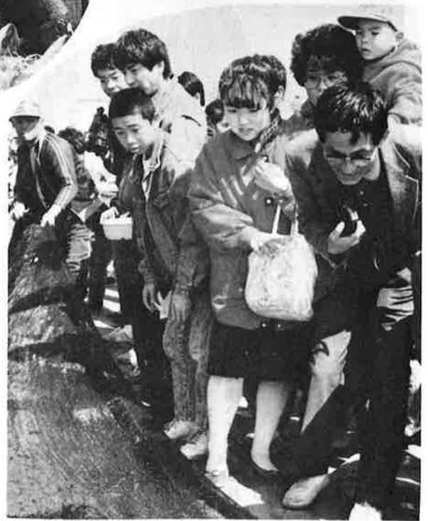
▲「わぁ、魚がかかった」と歓声があがる