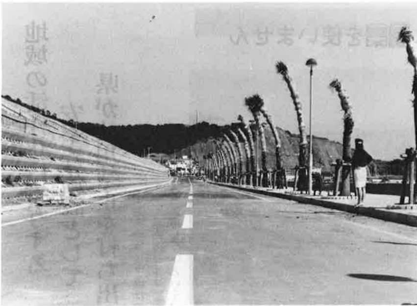
夏季の交通安全対策をはじめ、月の沙漠記念館と調和した潤いのある道路が完成しました。

月の沙漠記念館前から浦仲 地先を経て、岩和田へ通じる 海岸道路が完成しました。 この道路は、観光客でにぎ