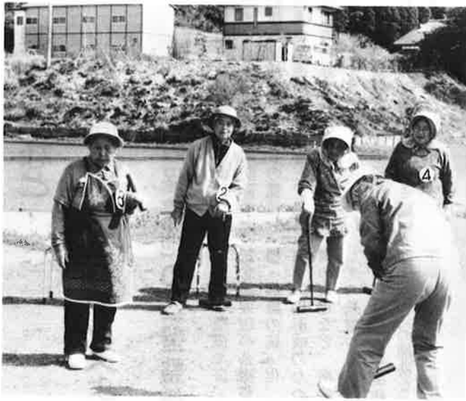
健康で生きがいのある老後を——福祉センターやゲートボール場整備など お年寄りのための施策を推進

暮らしや老夫婦世帯を増加させており、お年寄りが健康で暮らせる町づくりを念頭に、福祉予算を編成しました。特に、お年寄り相互のふれ