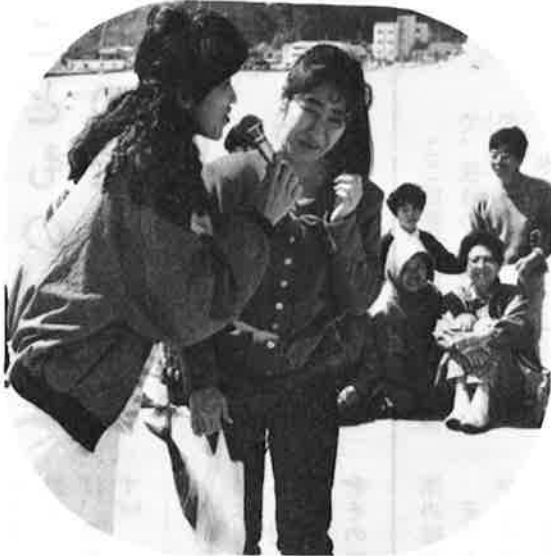
▶ 抽選会の景品も新鮮なお魚でした