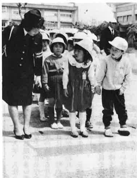
指導員の指示で、横断歩道の渡り方を学ぶ新一年生たち

入学したばかりの新一年生は横断歩道や、信号、歩道橋などの横断の仕方を中心に、道路を歩く上での注意点を勉強しました。一年生のおかあさんもお子さんの交通安全につ