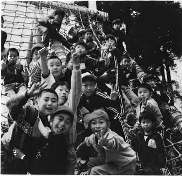
きみたちの明るい未来を積極予算で築きます