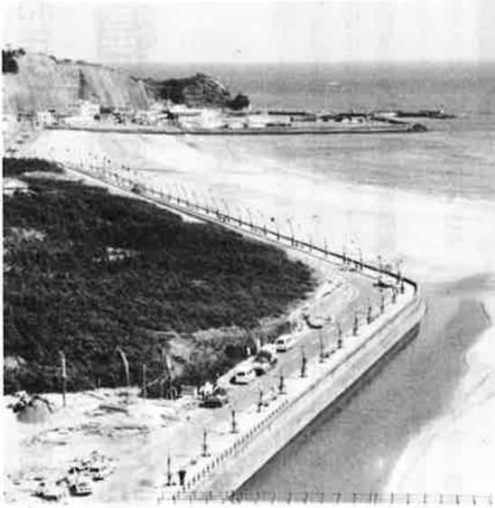
青い海と緑の丘陵——恵まれた自然を生かした保養地をめざし基盤整備を進めます。

このほか、本年度建設される商工会館への補助など、地元商工業の活性化を促進します。