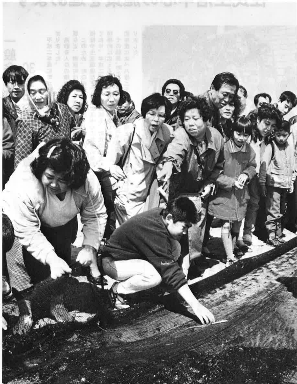
地曳網や新鮮なお魚料理で楽しい海辺の一日(春休みお魚ウィークス行事)