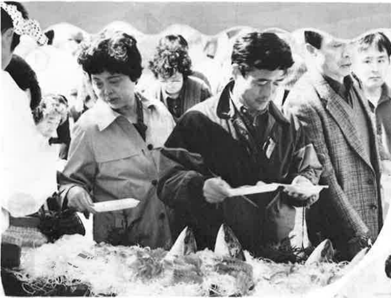
▲お刺身、揚げ物などお魚料理がふんだんに