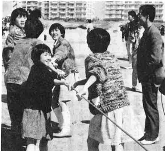
▲ 温かな春の海岸——綱引く顔に笑顔がこぼれます

三月十九日から二十五日の一週間、観光客に新鮮なお魚をたくさん食べていただいた、お魚ウィークス。二十五日の最終日には中央海岸で、楽しいイベントが開催されました。各団体の模擬店では、七キロもあるかじきマグロのお刺身を始め、するもん汁や、あじろ揚げ、栄養改善会によるいわし料理のサービスもあって、東京や、関東以外からやって来たお客さんも、熱々の揚げ物をほおばっていました。また網代湾に仕掛けた地引き網に、普段はお魚屋さんでしか見ることはない魚がかかっているのを見てびっくり！という場面も見られ、楽しい一日となりました。