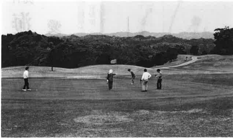
地元経済の活性化に加え、安全面でも信頼できるレクリエーション施設として期待されるゴルフ場