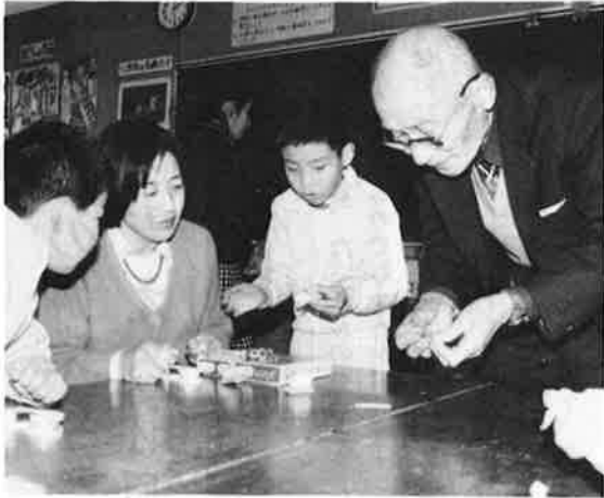
子どもたちの豊かな心を育む教育施策を推進します