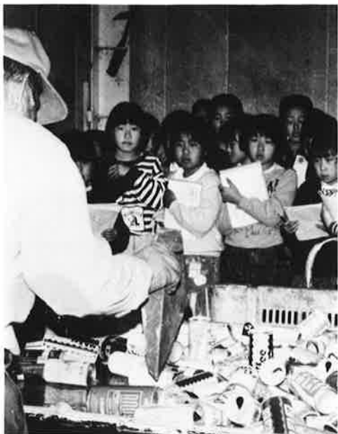
子供達も空き缶のリサイクルについて学びます。

ゴミのない、きれいな町づくりを目指す御宿町では、町民のみなさんの参加による「町民清掃」や「環境機動隊」により、散乱ゴミなどを収集し、環境美化に取り組んでいます。六月三日には、ゴミゼロ運動の一環として、町民のみなさんのご協力をいただき、クリーン作戦を実施します。そこで、散乱ゴミの現状と環境美化について取り上げてみました。