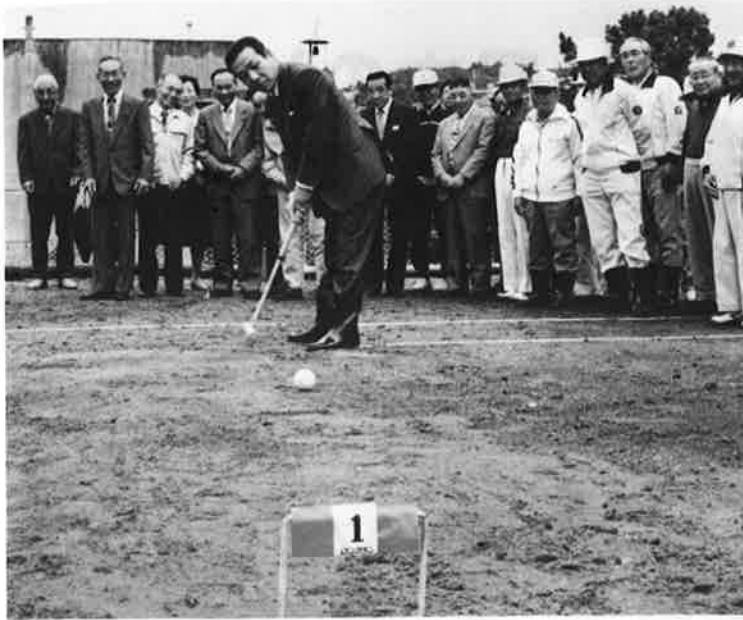
ふれ合いと、健康づくりの場、ゲートボール場が完成 —実谷地先—

このほど、実谷地先で整備を進めていたゲートボール場が完成。コート開きが行われました。