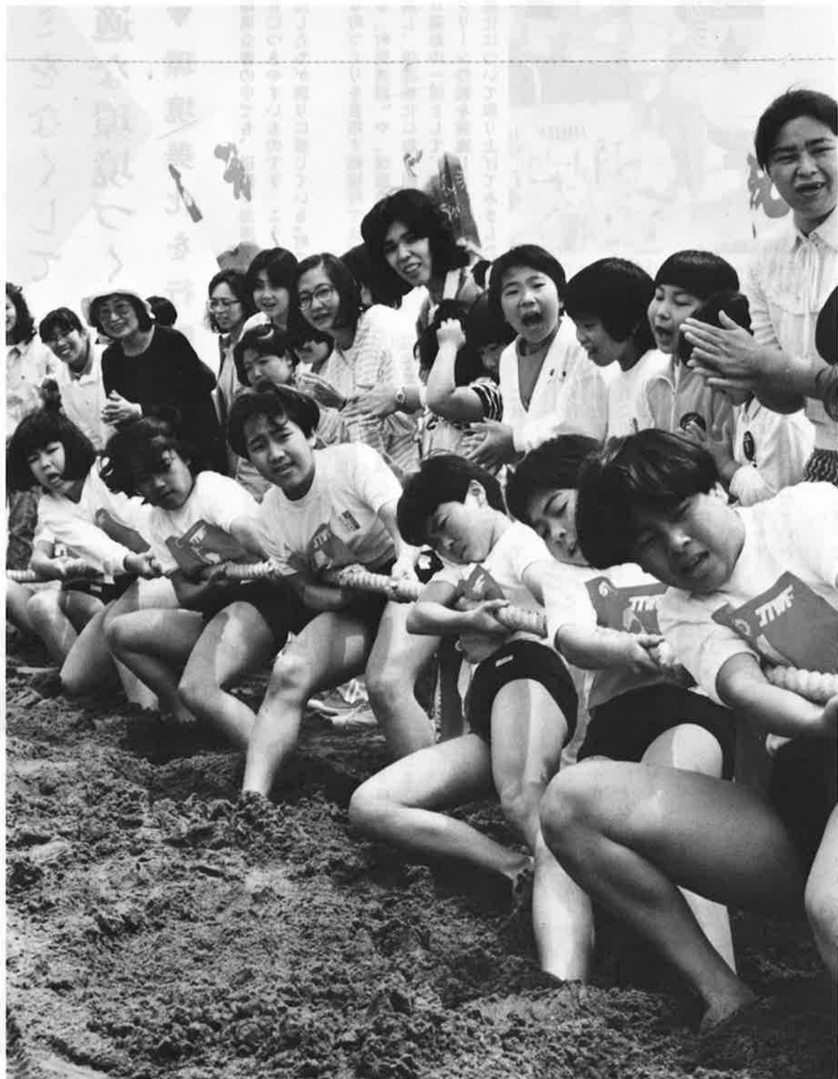
みんなで参加・みんなで楽しんだ海辺の祭典(太平洋綱引大会)