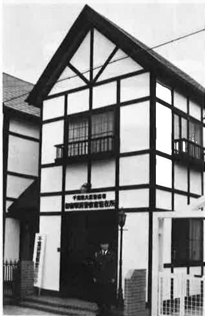
町全体で保養地のイメージ作り 駅前駐在所も一役を担います

完成した駐在所は、木造二階建てで面積八十九平方メートルのペンション風のモダンな建物です。