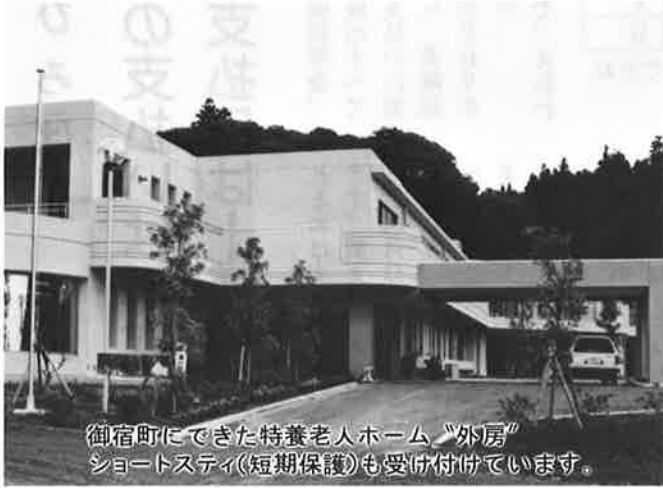
御宿町にできた特養老人ホーム「外房」 ショートステイ(短期保護)も受け付けています。