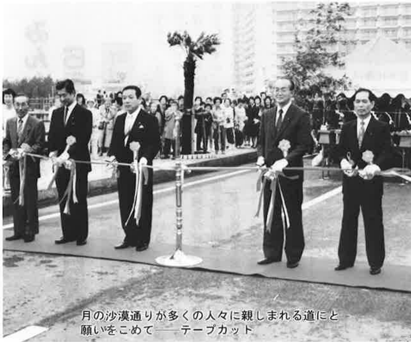
月の沙漠通りが多くの人々に親しまれる道にと 願いをこめて——テープカット

五月八日、六軒町浦仲地先の町道一一六五号線、愛称「月の沙漠通り」の開通式が行われました。 この道路は、自然と産業が調和した海の保養地にふさわしい、青い海と白い砂浜が一