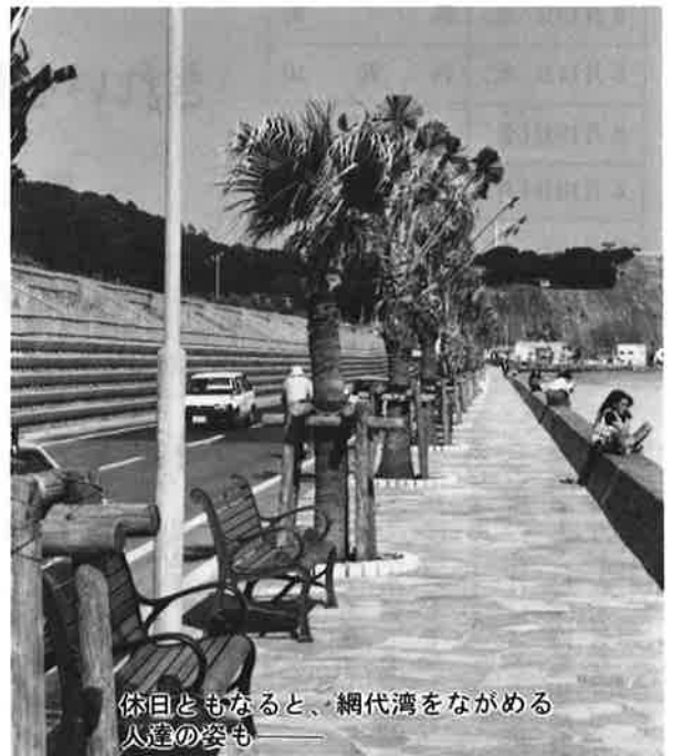
休日ともなると、網代湾をながめる人達の姿も

町では、道路網の整備を町づくりの重要施策として位置づけており、海岸周辺だけでなく、実谷から立山地先へ通じる新路線の促進やサンドス