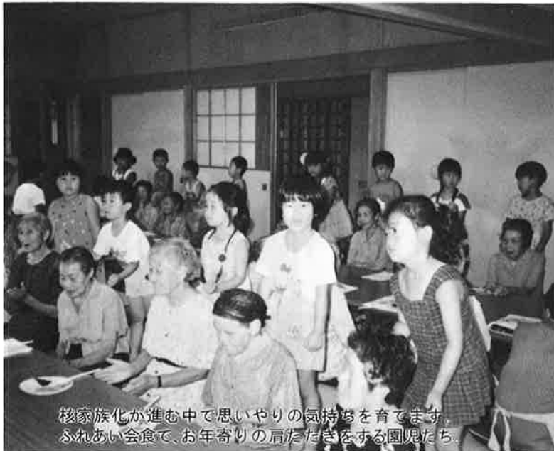
核家族化が進む中で思いやりの気持ちを育てます。ふれあい会食で、お年寄りの肩たたきをする園児たち。

人は、だれもが幸せでありたいと願う——病気の人は健康を最大の幸せと考え、独り暮らしの人は、語らいを一番の幸せと思う。幸福の基準は立場や環境で変化していくのだろう。 福祉とは、みんなが幸福になることだという。みんなの幸せを考えると、人を思いやる心が生まれる。その「心」こそ、福祉の原点ではないだろうか。 人生八十年時代——人口八千人余りの御宿町にも、高齢化社会の波は押し寄せている。お年寄りが「長生きしてよかった」と実感できる町をつくるため、人の優しさ、思いやりの心を育てる——これが、今後の福祉行政の在り方かもしれない。