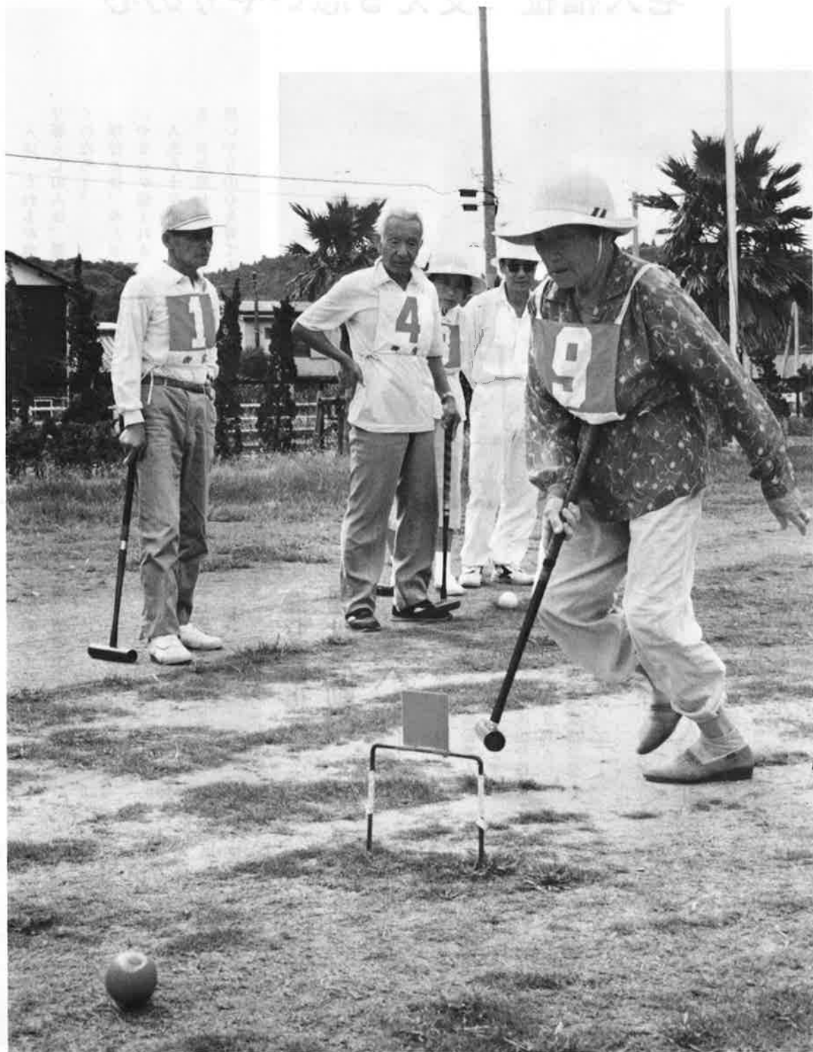
“第2ゲート通過”元気な声が秋空にひびきます(須賀多目的広場)