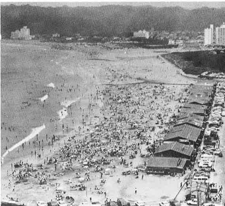
●海水浴客でにぎわう御宿海岸