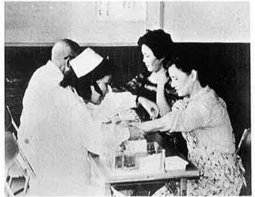
● 献血で成人病の検査もできます

6月26日に実施しました献血に左記の多くの方々(109名)からご協力いただき、どうも有難うございました。献血は健康な人だけができる大きな助け合いです。ご協力いただいた血液はむだなく活用され、献血への心づくしは人々に幸福の輪を広げています。血液は骨髄(骨の内部)にある軟かい組織の一部はリンパ腺で生まれ、赤血球・白血球・血小板・血しょうに分かれそれぞれの役割を果たします。それらの量や配分がくずれ、多くなったり、少くなったりすると病気になるわけです。しかし血液にも寿命があり(赤血球は120日位・白血球・血小板は10日位)私達の体内には、生まれたばかりの血液もあれば、寿命に近い血液もあります。では献血をすると血液が足りなくなりはいないかという問題ですが、献血一回量は200ml、血液は生きものですので量は数時間で回復しますが、血球数が回復するまでには数週間かかります。この為1ヶ月以内の献血はできないことになっていきます。私達の体には5〜6ℓの血液がありますが、この血液の量は体にとって絶対必要な量ではありません。もしそうならば少しの出血で貧血になったり生命が危険になったりするはずですが、献血しますと、血液型・貧血・血庄・肝臓・腎臓・コレステロール等の検査を無料で受けることができます。つまり、献血で成人病の早期発見ができるわけです。町では年2回献血を行っています。是非ご利用下さい。比重が低かった方は、食事・日常生活に注意し、早く治すようにしましょう。 ※ 献血手帳は大切に保管しましょう