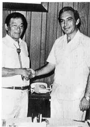
アミン・アカプルコ市長と握手

国際観光都市アカプルコは益々発展し、今や人口八十万人に達しようとしている。昨年十一月七日市長選挙が行われ、前市長フイゲロア氏に替って、新しくアミン氏が今年の一月一日から執務している。アミン氏は一九三六年生れ四十五歳、前のゲレロ州（アカプルコのある州）の漁業局長、現在メキシコ合衆国生物学者協会会長を兼務し、水産学者であると共に、