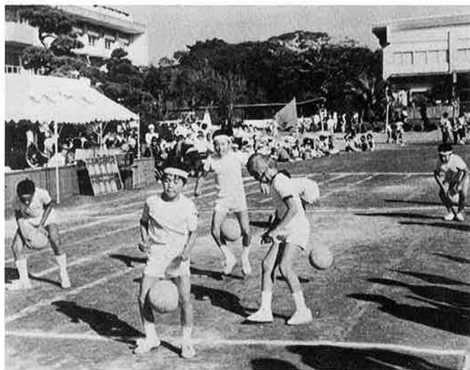
元気よく、はねてみたけれど

急激な運動は、健康だからといっても危険です。たまの運動より毎日少しずつ運動することに限ります。体育祭を良い機会にして、毎日運動をする習慣を身につけましょう。