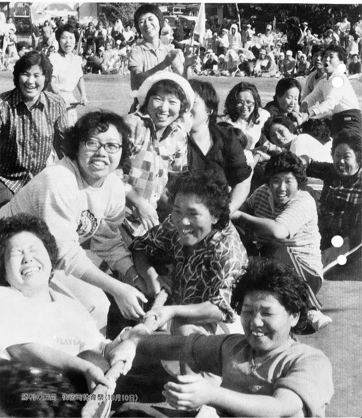
勝利の瞬間 御宿町体育祭(10月10日)