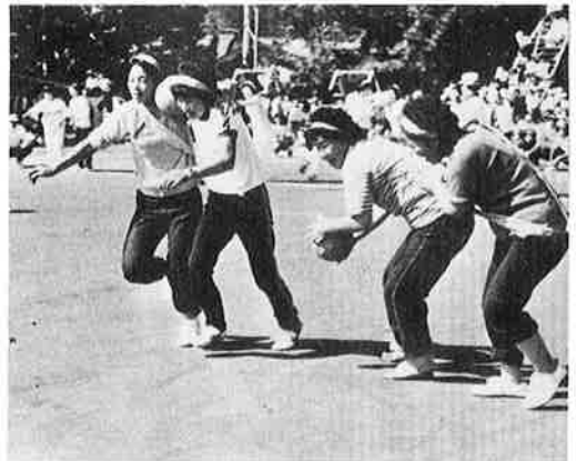
がんばれノおかあさん