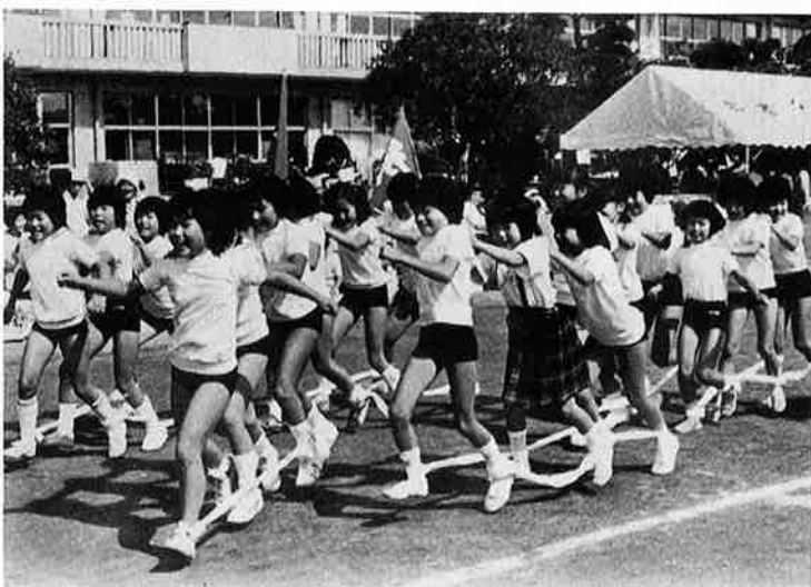
ゴールめざして急げノイチニ、イチニ

10月10日体育祭が御宿小学校で開催されました。 総合優勝は新町で、準優勝は六軒町でした。