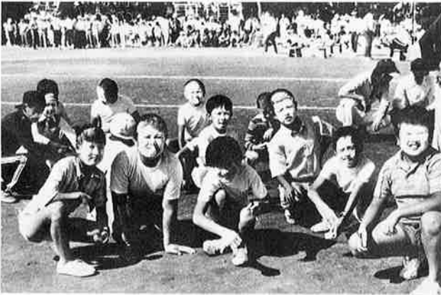
グッドメイクアップノはいポーズ