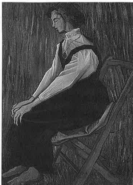
少女は腰かけている 1954