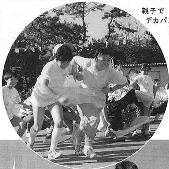
親子で デカパン レース