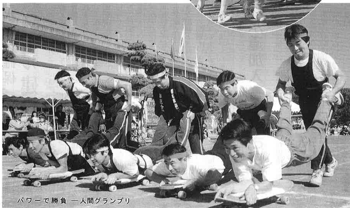
パワーで勝負 — 人間グランプリ