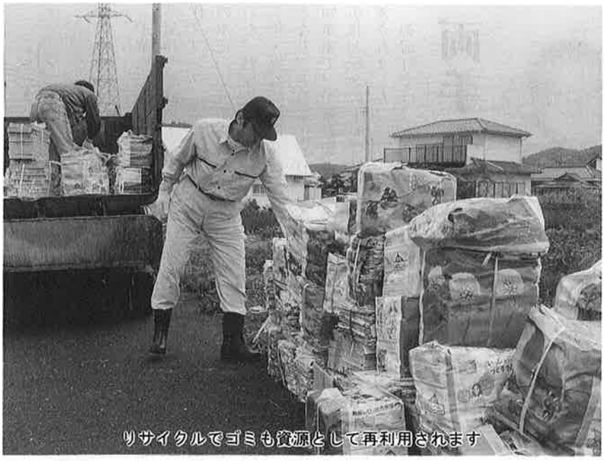
リサイクルでゴミも資源として再利用されます