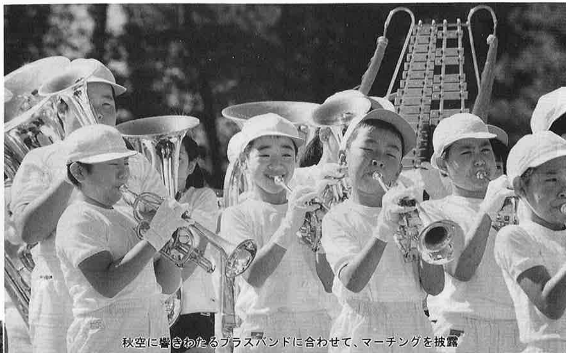
秋空に響きわたるブラスバンドに合わせて、マーチングを披露