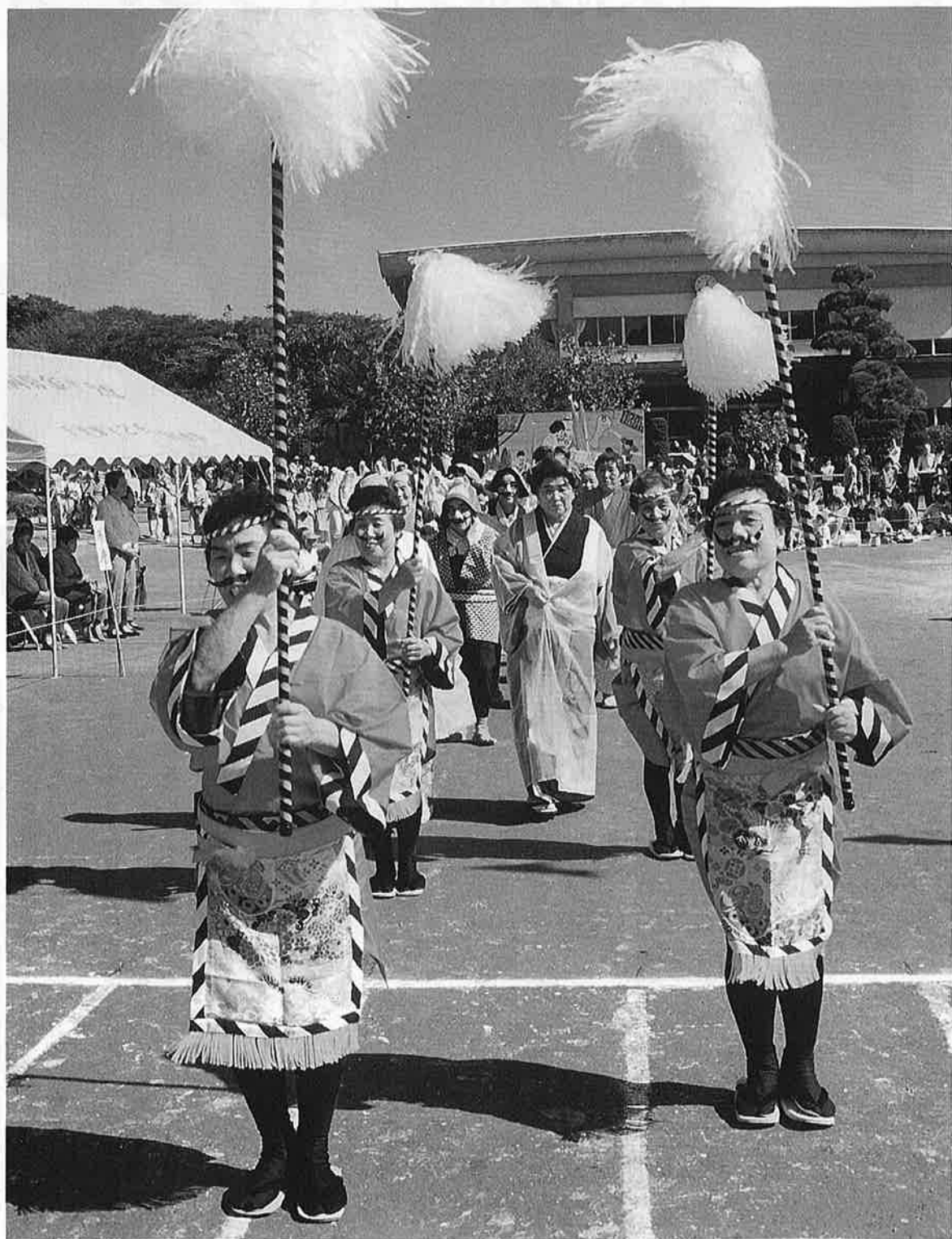
秋空の下、色鮮やかな仮装行列 — 町民体育大会 —