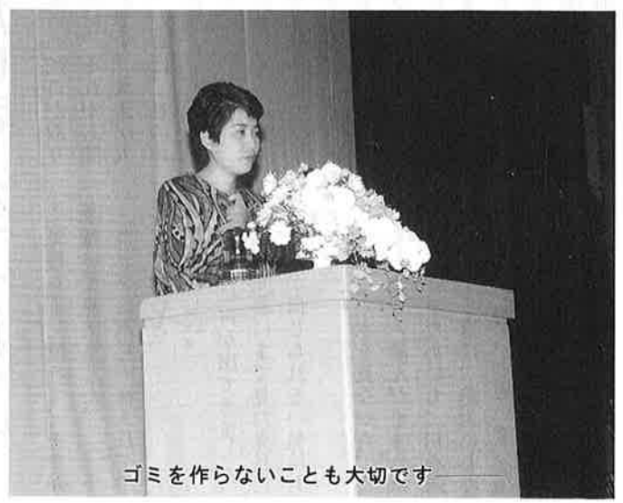
ゴミを作らないことも大切です