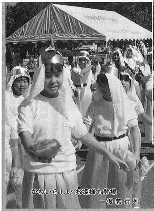
かわいらしいお姫様も登場 — 仮装行列