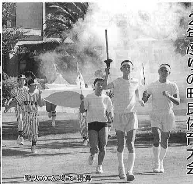
聖火の入場で開幕