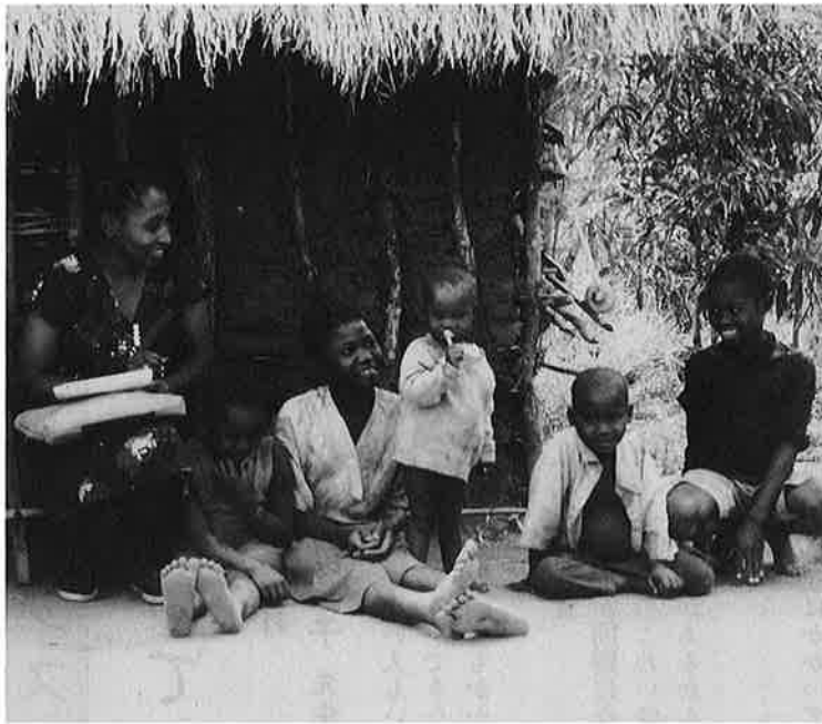
さとうきび、泥、ヤシの葉でできた家。家庭訪問をした時に撮影！