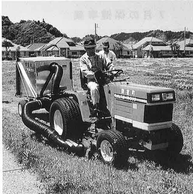
自治宝くじ収益金により整備されたスポーツトラクタ