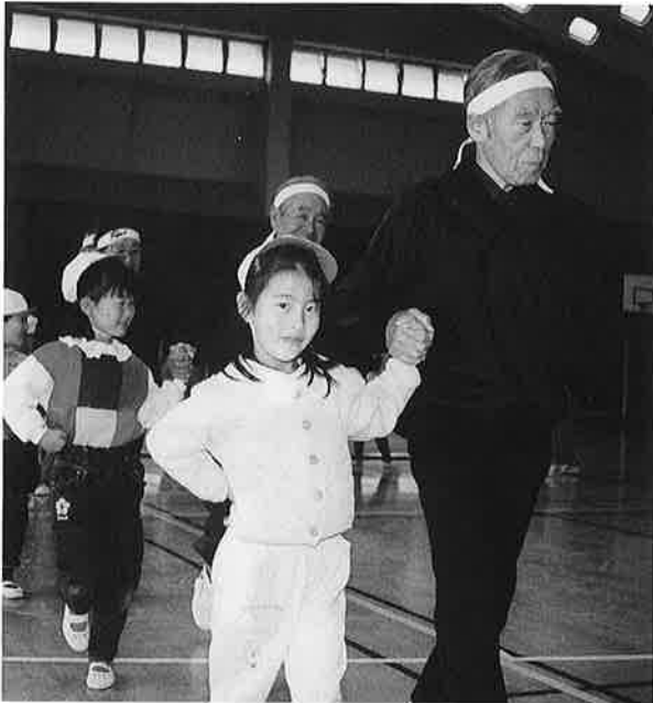
わくわくスポーツ大会

町では、今後予測される本格的な高齢化社会の到来に伴う多くの課題に対処するため、このほど「御宿町老人保健福祉計画」を策定しました。これは、平成六年度から十一年度までの六カ年計画で、将来必要となる保健福祉サービスの内容や提供体制の整備・推進目標を具体的に示したものです。今月号ではその内容を紹介します。