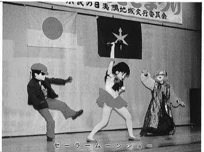
セーラームーンショー

また、御宿小学校校庭ではふるさと特産市、御宿中学校校庭では老人スポーツ大会が行われ、多くの人が初夏の1日を楽しみました。