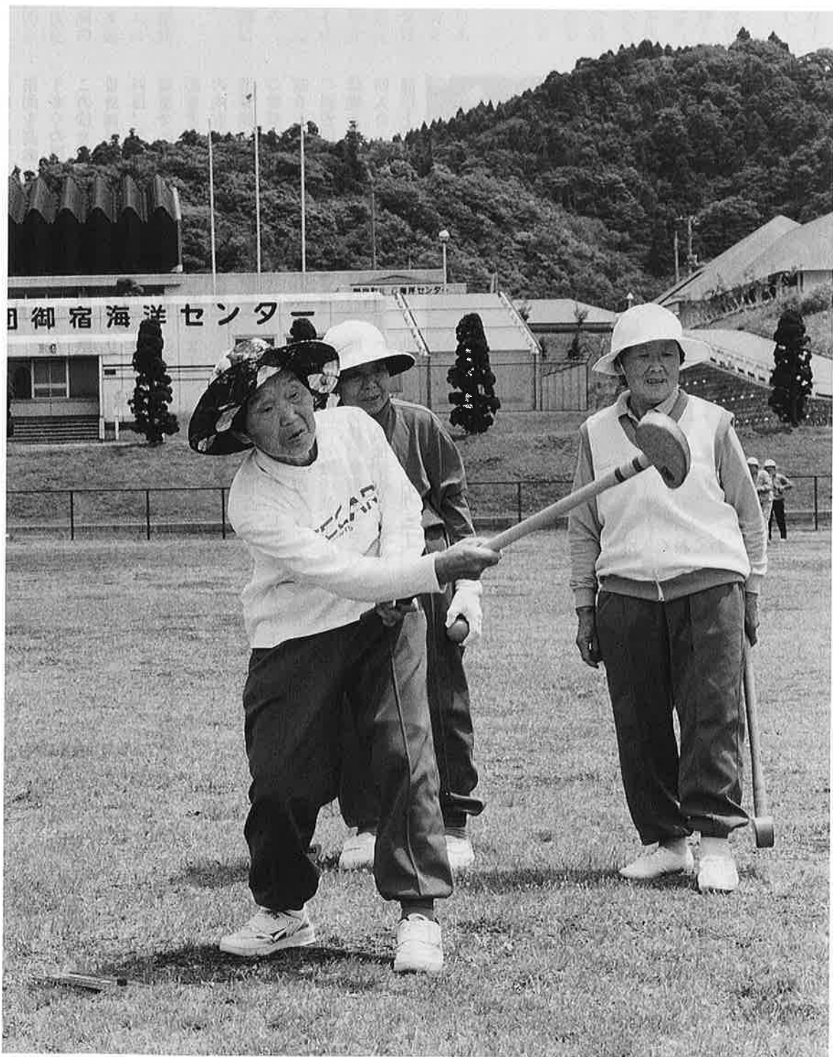
ナイスショット(老人スポーツ大会グランドゴルフの部)