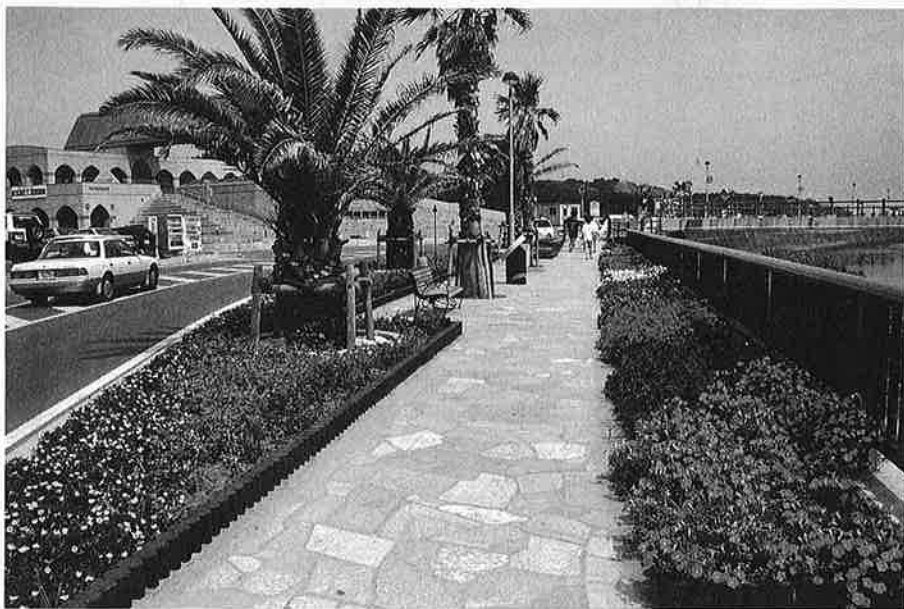
“花いっぱい”の月の沙漠記念公園

黒潮・親潮にきたえ、育まれた人間の素朴さと野性味に、柔らかな花の光をあててみよう。何かと乾きやすい日常の心に一片のうるおいを与えてみよう。