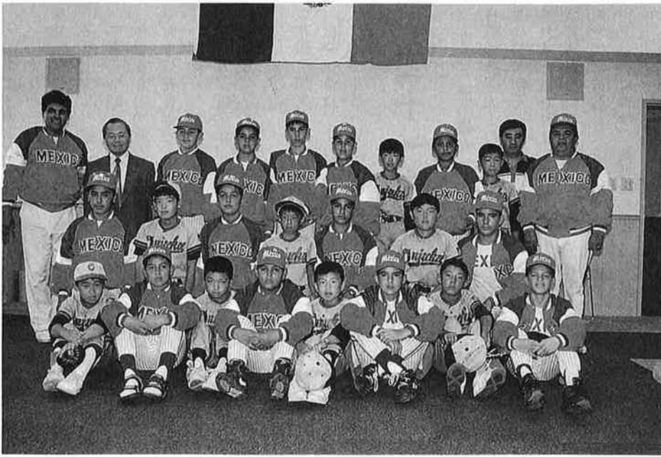
メキシコと御宿の子どもたち