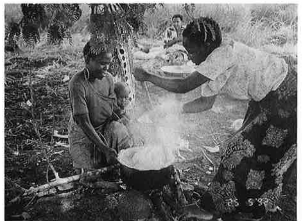
母親は、子供たちのために自分達で調理する

いってもあるだけの食べ物も効率よく、そして工夫して摂り、また農産物を増収する指導が先決問題です。しかし、いくら収入や収穫が増えても、