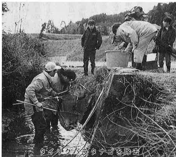
タイリクバラタナゴを除去