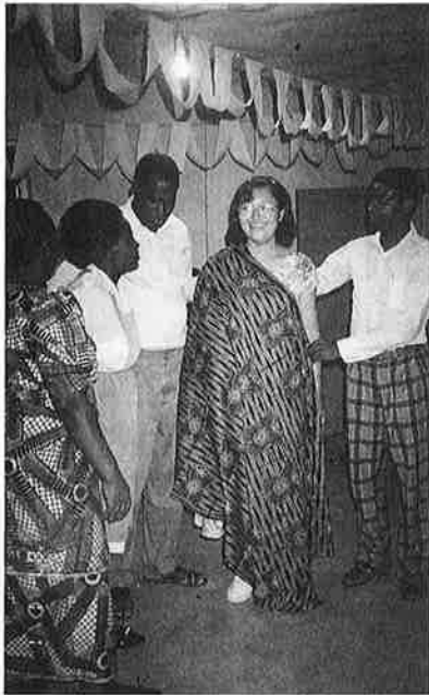
プレゼントは民族衣装用の布地でした