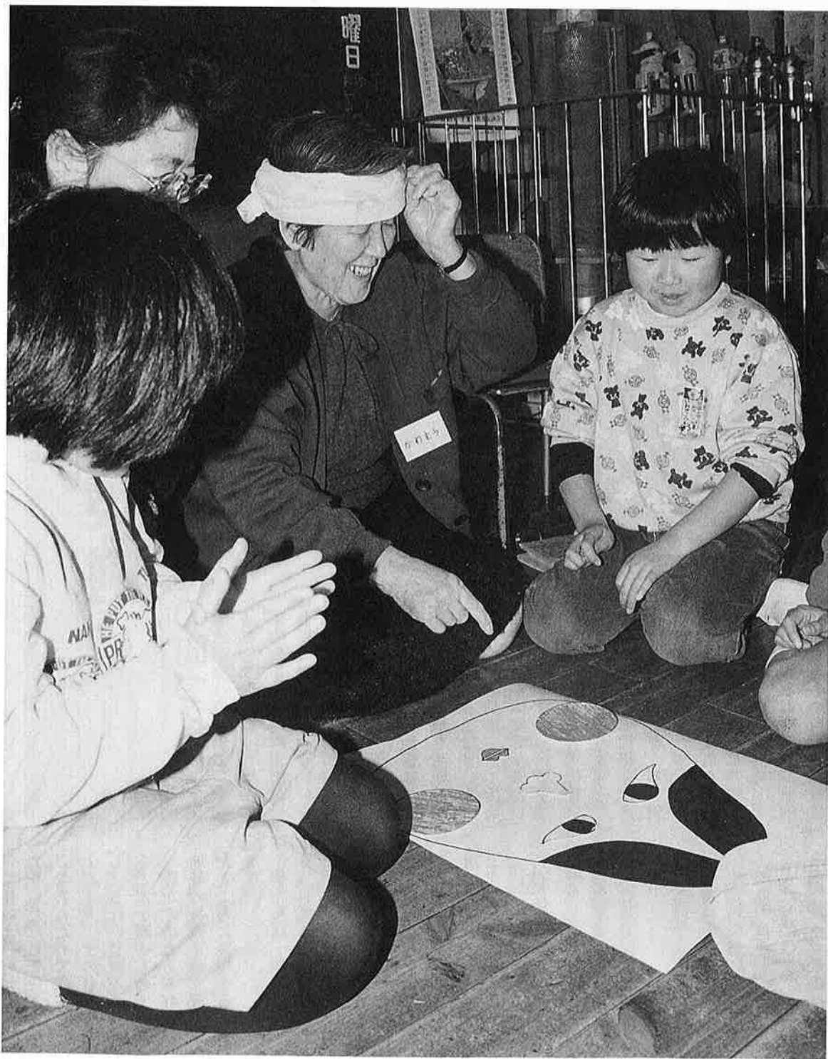
福 笑 い (高齢者ふれあい教室)