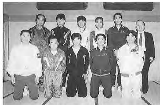
一般の部で3位の御宿町チーム