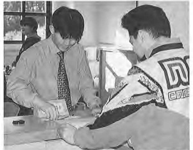
申告等のご相談はお気軽に税務課へ

御宿町に一月一日現在、住所のある人に対し、前年の所得金額を基礎に課税します。 御宿町に住所がなくても、家屋敷を所有している人は、均等割（町県民税三千円）が課税されます。 一月一日現在、住所のある