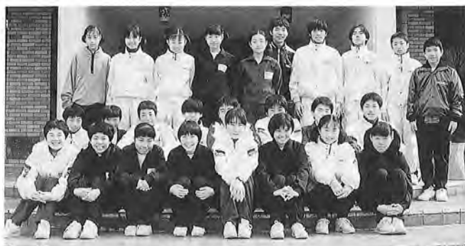
健闘した御宿中チーム