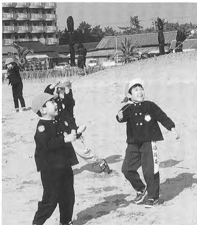
「わーい、あがった!あがった!」

字を書き、手作りの凧が完成しました。 そして二月十二日、自慢の凧を持ち寄り、三校合同の凧上げ大会が記念館前の海岸で行われました。空高く上がるもの、どうしても落ちてしまうもの、糸が絡んでほどけなくなるもの等様々でしたが、子どもたちは手作りの遊びの楽しさを体験しました。 当日は、御宿・岩和田両保育所の子どもたちも小さな凧を持って参加しました。