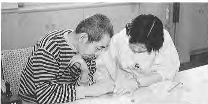
今年からヘルパーさんも増えました

阪神大震災で問題となったひとり暮らしの高齢者や寝たきりの方の災害時の支援が的確に行われるよう、地域の消防団や区役員の皆さんたちへ