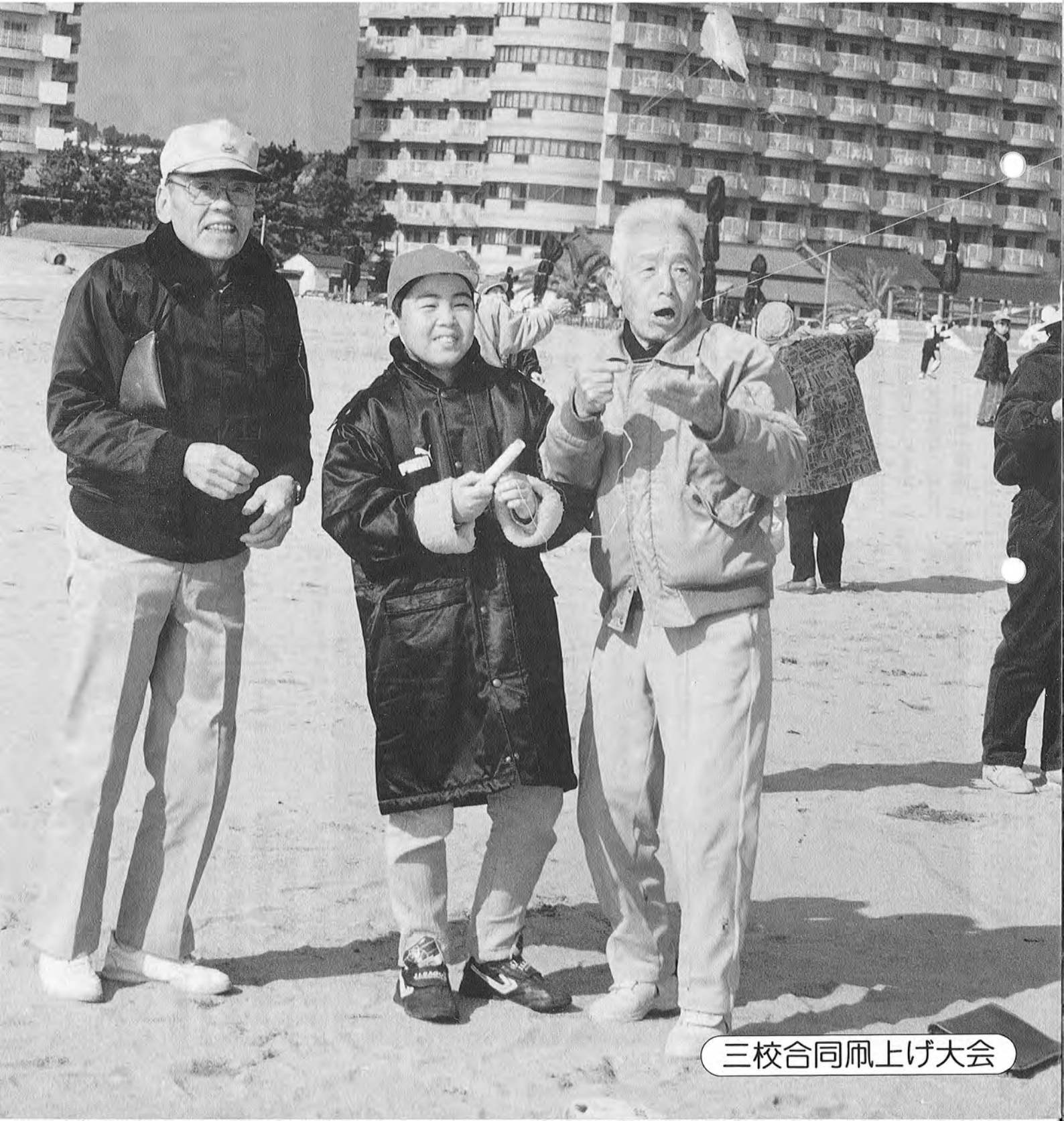
三校合同凧上げ大会