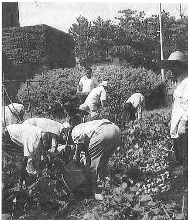
公民館の主催事業である菜園教室。野菜作りを基礎から学びます

また、地域活性化の一つとして、商工会が実施する地元振興事業に対する補助金や中小企業利子補給に係る経費を計上しました。