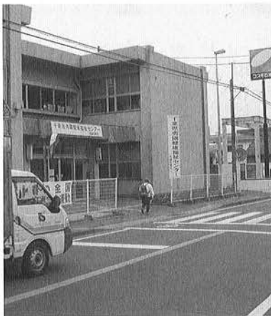
勝浦保健所が夷隅健康福祉センターに変わりました

■相談日 毎月1回第4金曜日(12月は第2金曜日、1・2月は第3月曜日、3月は第2月曜日)、受付時間は午後1時から2時。費用は無料、予約制です。