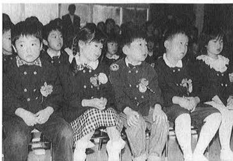
御宿保育所終了式の様子