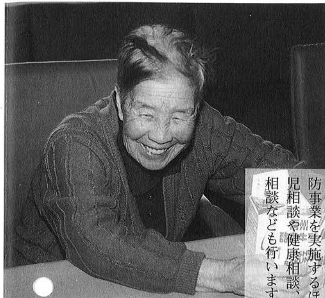
笑顔があふれる福祉事業を行っています