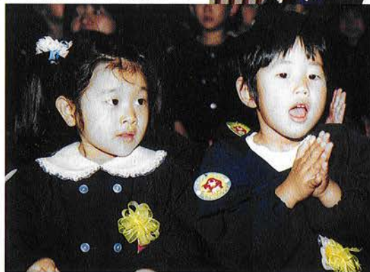
↑ (岩和田小学校入学式) ← (御宿保育所入所式)