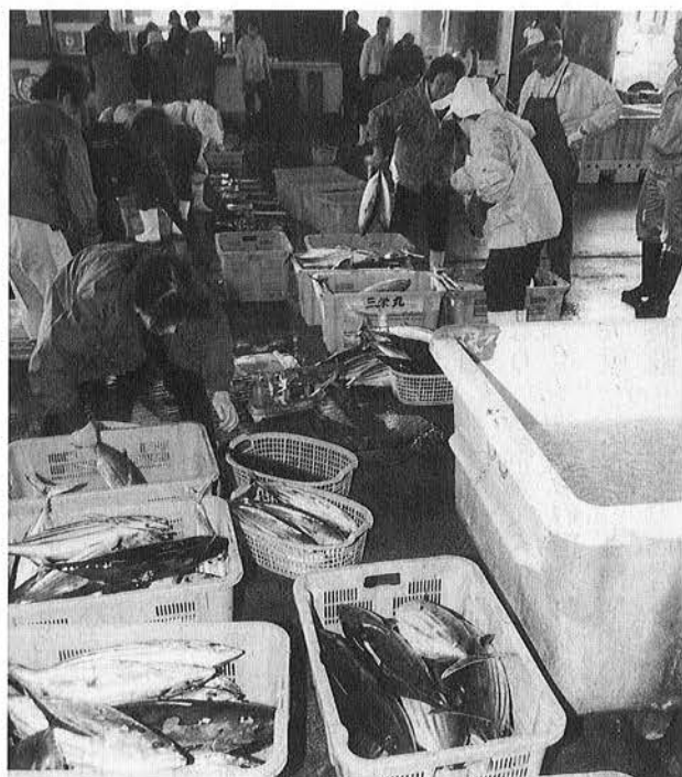
カツオの水揚げで賑わう岩和田漁港

平成十六〜二十年度の計画で、岩和田漁港の整備を行います。今年度は、東防波堤と消波ブロックのかさ上げ工事を行います。さらに係船の破損防止のため、両漁港の船付場のかさ上げを行います。いのしし対策では、檻三基とひもわなを