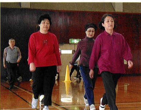
自分のペースで継続して行っていくことが大切です