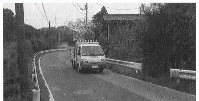
340m（3カ年）の道路改良工事を行う町道0106号線

して、充実した児童館運営を図っていきます。 児童手当支給事業については、制度改正により、支給対象が就学前から小学校三年生まで拡大されました。また、第三子の誕生から三カ年で九〇万円を給付する出産育児祝金や子ども健全な成長を願う小学校入学祝金（町地域振興券の給付）を計上し、保護者の負担軽減を図る支援策を行います。