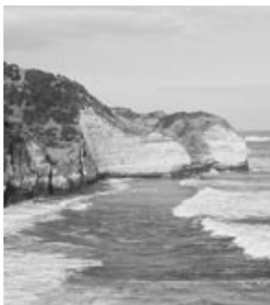
約 300 人の乗組員が助けられたとされる田尻海岸

人を救う・守るという精神はライフセービングの根底であり、当時の海女さんは現在でいう「ライフセーバー」であったと考えられないでしょうか。