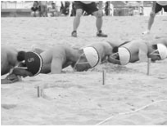
会場のコンディションには不安なく、競技に臨めました

選手が持てる力を最大限に発揮できるよう、大会前日には宿泊業組合の方々に手作業による会場の細かなゴミ拾いを行いました