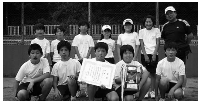
御宿町青少年のつどい大会成績

また、8月4日には、夷隅支部大会が開催され、本大会で3位までの4チームが町を代表して参加しました。惜しくも入賞することはできませんでしたが、日ごろの練習の成果を発揮し、精一杯頑張りました。