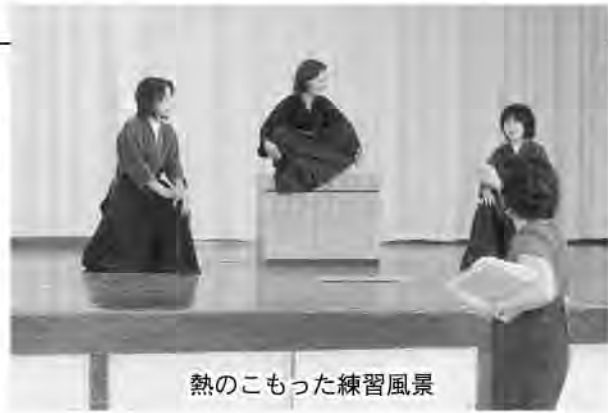
熱のこもった練習風景

御宿中学校の1年生が、野沢温泉中学校の1年生を迎えた7月29日の海山交流の歓迎式で、400年前の寸劇を披露しました。中学校では、総合的な学習の時間を利用して、史実の講話や史跡の散策等により、誇りある祖先の偉業を学習しています。この寸劇も野沢の皆さんに御宿の素晴らしい歴史を知ってもらおうと、生徒自らが資料をまとめ、台本を作成したものです。