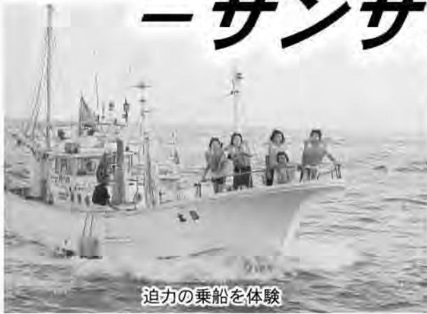
迫力の乗船を体験

歓迎式のあと、両校の生徒たちは岩和田漁港へ。漁師の皆さんの協力により、14隻の漁船に乗り込み、網代湾でのクルージングを楽しみました。初めて漁船に乗船する野沢の生徒はもちろん、小学生の時に乗船体験で漁船に乗ったことがある御宿の生徒からも船上のスピード感や波しぶきに歓声と悲鳴が上がり、服を濡らしながらも乗船体験を堪能していました。