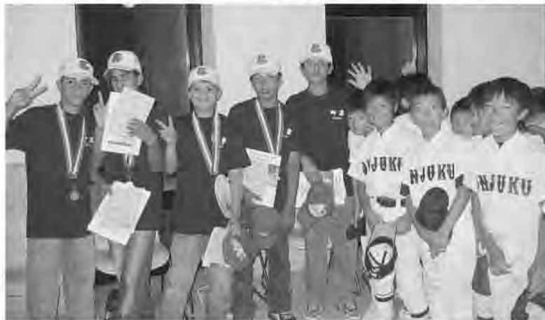
メキシコの子どもたちと直に触れ合いました