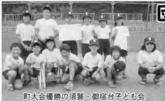
町大会優勝の須賀・御宿台子ども会