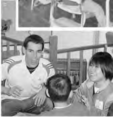
◀今日の調子は どうですか?