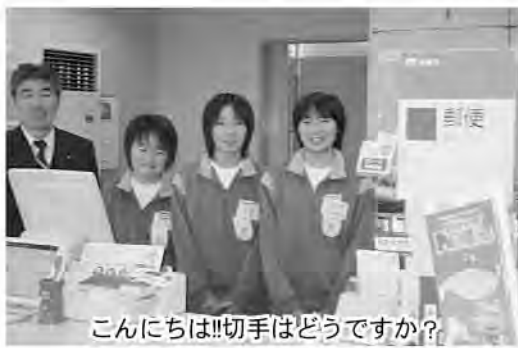
こんにちは!!切手はどうですか?

「心臓が痛くなってきたあつ」「覚える事が多くて大変だよ〜っ」と言っていたみんなでしたが1日が終わると「思っていたよりも楽しく仕事が出来たあ。」と仕事の楽しさを見つけることができました。