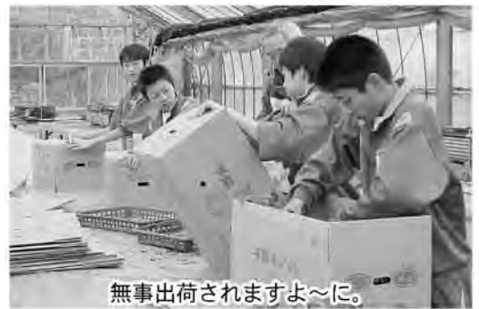
無事出荷されますよ〜に。

どの場面でも子ども達と遊んだり、話したりしている姿はまるで保育士さんそっくりでした。