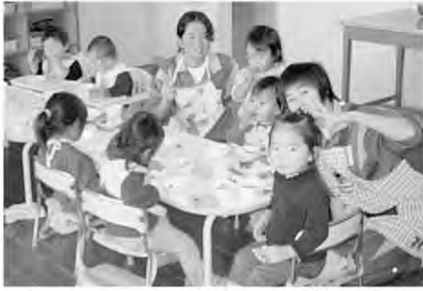
▲いっただっきまーす!!