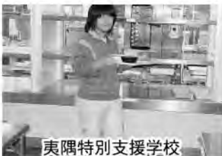
夷隅特別支援学校