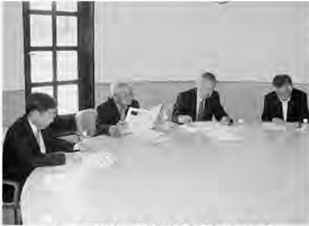
現在、分団統合に向け協議を重ねています

今回は分団統合に向けた中間報告として、協議を進めている主な事項についてお知らせします。