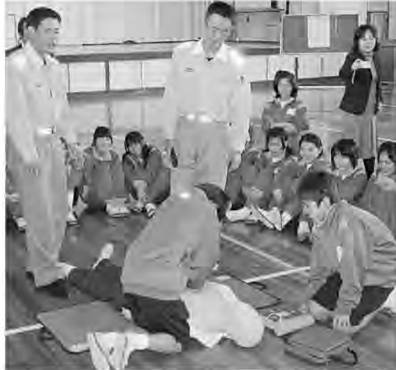
御宿中学校ではAEDの設置に先駆け、家庭教育学級で救急救命方法の講習を行ないました

「ふるさと御宿」を愛する皆さまからの寄附「活力あるふるさとづくり基金」を財源として、御宿中学校にAED（自動体外式除細動器）を設置することになりました。 このAEDは、電氣的ショックを心臓に与える機器で、突然の心停止の主な原因である心臓が痙攣したような状態になる不整脈の効果的な応急処置方法となります。 心停止の際は、少しでも早い処置が必要であり、時間の経過とともに生存率が低くなってしまいます。そして、スポーツ中の突然の心停止の報告が多くあることから、部活動などで激しい運動を行うことが多い御宿中学校に設置することとしました。 今後は、いざという時に備え、応急措置に対する知識や技能の習得を推進していきます。