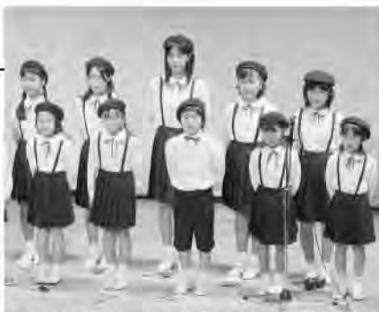
「シエリトリンド」を合唱する御宿児童合唱団