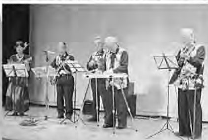
ハワイアン研究会は「ベサメ・ムーチョ」を演奏