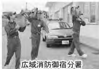
広域消防御宿分署