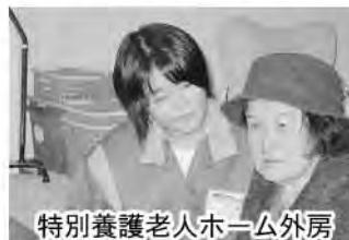
特別養護老人ホーム外房