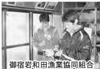
御宿岩和田漁業協同組合