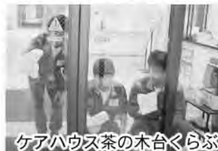
ケアハウス茶の木合くらぶ