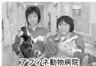
アフィネ動物病院