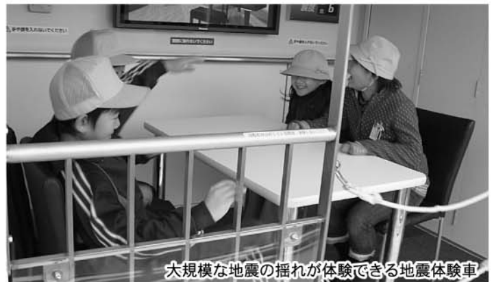
大規模な地震の揺れが体験できる地震体験車

想以上に揺れた。「周りの家具が倒れてくると危険。」などの感想があり、子どもたちは地震の怖さを感じた様子でした。 また、煙体験ハウスでは、人体に無害な煙を充満させた仮設ハウスの中を進みました。「前が全く見えなかった。」「ハンカチを口に当てていても少し苦しかった。」など、火事の際は火よりも危険といわれる煙の怖さを味わいました。 消防団活動の体験では、右へならえ、回れ右、敬礼などの規律訓練を行い、きびきびとした動作に最初は戸惑っていた子どもたちもしっかりと基本動作ができるようになりました。また、消防団員からホースやポンプなど、消火活動に必要な機材の説明を受け、実際に消火栓からの放水体験も行いました。 小川消防団長からは、消防団の役割や町の火災状況、日常生活における注意事項などが分かりやすく説明され、子どもたちは興味深くノートに