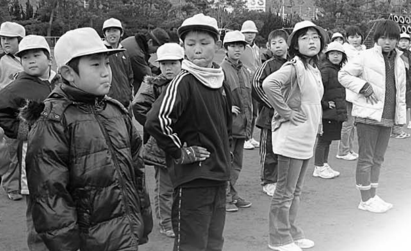
「右へならえ」 消防団活動として規律訓練を体験

地震体験車では、関東大震災や阪神・淡路大震災、新潟県中越地震など、震度6から7の地震を再現しました。「予