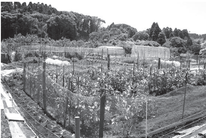
▲未使用であった土地を貸し農園として再生

土業の前進に向けた担い手育成や定住化の促進事業さらには体験型産業の構築など地域活性化に向けた一体の取組みが非常に重要なこととなります。