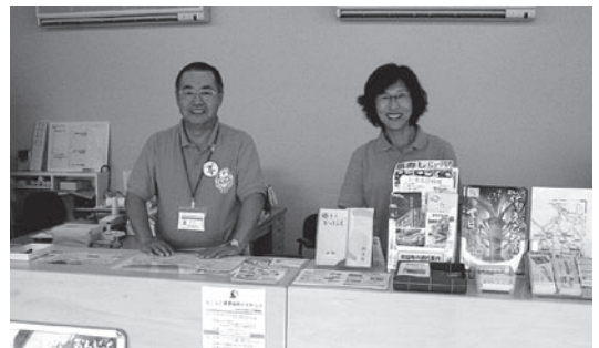
▲「町の魅力をご案内します」

老朽化の進んでいた御宿駅前観光案内所が、リニューアルオープンしました。オープン当日は町長や町議会議員など各関係者が出席のもと竣工式を行い、町長からは「この案内所を観光情報の発信拠点として活用したい」との言葉がありました。 当案内所は（社）御宿町観光協会が指定管理者となり運営するもので、観光客に対し町の魅力を発信していきます。また、新たな取り組みとして、観光客へ自転車を貸し出すなどの新しい観光施策を展開していきます。