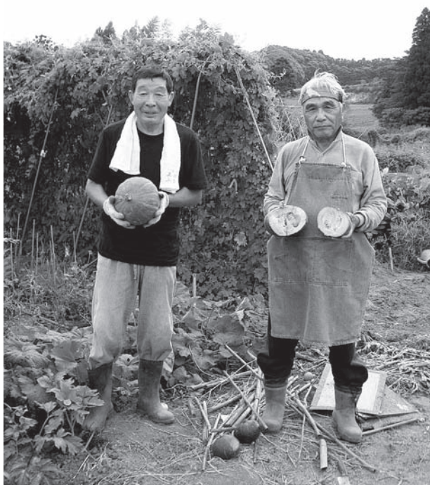
▲栄養たっぷりの御宿の野菜