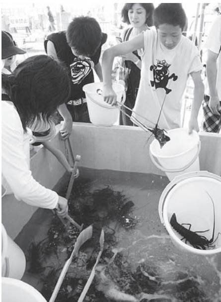
▲伊勢えびのつかみ取り

毎年多くの方々から好評を頂き、今年で11回目を迎える「おんじゆく伊勢えび祭り」が、9月1日からスタートしました。祭り期間中は、町内22箇所の参加店において、お造りや鬼殻焼きなどのオリジナル伊勢海老コースを食べることができま