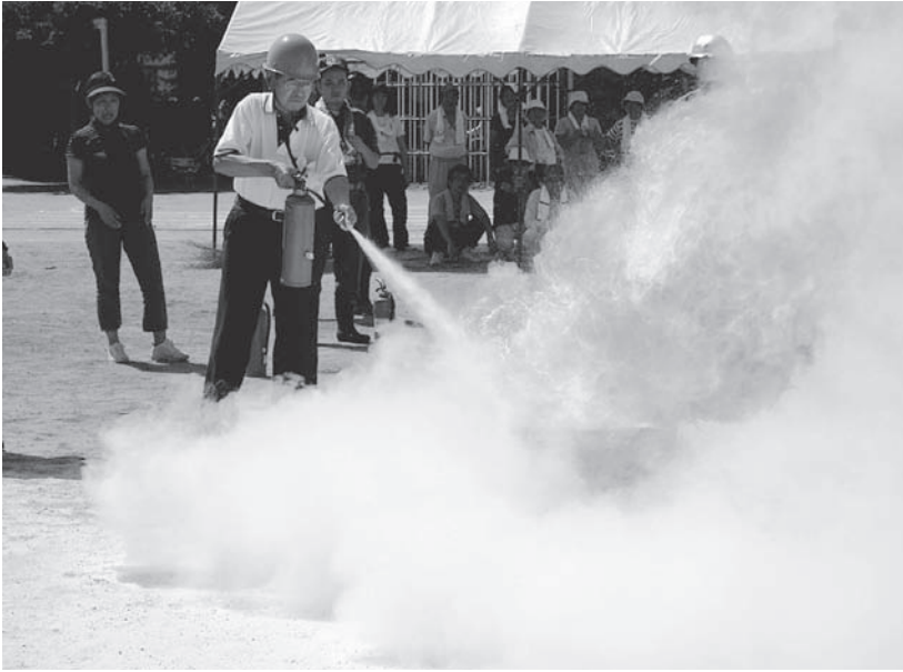
▲消火のコツは火元をほうきで掃くように！

自主防災会及び消防団による防災訓練が9月5日に町内の各地域で行われました。当日は、災害発生時の初期活動として、初期消火訓練やAEDを活用した応急救護法などを実施しました。 地震や風水害などの自然災害、火災や爆発などの人為災害、災害はいつ自分の周りで発生してもおかしくありません。 地域の防災力を高めるためには、日ごろからの備えと、家族や地域とのコミュニケーションが大切になります。