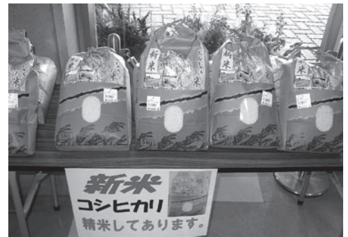
▲栄養たっぷりの御宿の野菜

今年度は、「おんじゆく米」のさらなる普及を目指し、当米を使った御宿ならではの創作こめ粉料理を模索しています。創作こめ粉料理は文化祭などで公表する予定です。