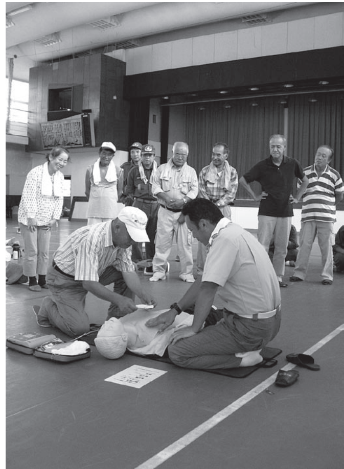
▲AEDは手順を守って適切に！

今回の防災訓練では久保・新町・六軒町・上布施・実谷区の自主防災会が中心となり合計209名の住民が訓練に参加しました。 御宿小学校では、久保・新町・六軒町の自主防災会が消火器を使用した初期消火訓練やロープワーク講習をグラウンドで実施。また、体育館では応急救護の講習が行われ、人口呼吸や心臓マッサージによる心肺蘇生法、AEDの使用法、止血法などを教わりました。 広域消防署の職員は、「講習会で学んだことを、実際の現場でスムーズに行うことはとても難しい。しかし、率先して行う勇気が最も重要なことです。」と話していました。 災害はいつ発生するか分かりません。しかし、いつも私たちはその災