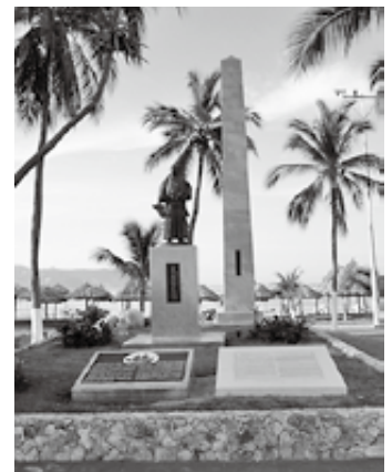
▲日本の広場の様子

始めにメキシコ国歌、次に「君が代」が演奏され、この事業が姉妹都市交流事業であることのみならず、メキシコ合衆国と日本国との交流事業であることに強く胸を打たれた次第です。