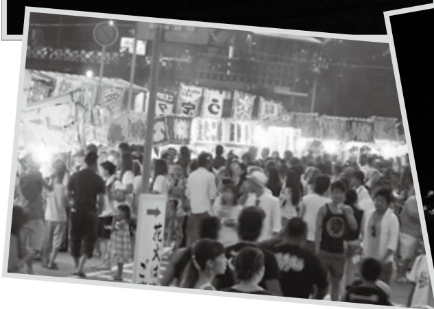
▲今年も花火が始まる前から多く人で賑いを見せました