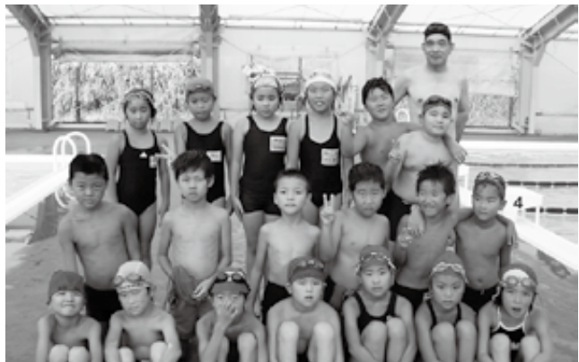
◀ 2・3年生のクラスのみんな

8月5日（日）には、水泳技能認定が実施され、子どもたちは5日間の教室での成果を披露し、それぞれの泳力に応じた認定証がB&G財団より交付されました。 また、期間中には泳ぎの上達だけではなく、水の危険性についても学ぶプログラムが行われ、水の事故を防止する為の心構えや対処法などを学びました。