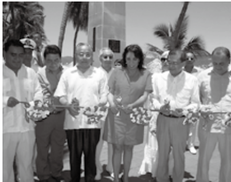
▲竣工除幕式・テープカットの様子 写真中央に石田町長とペロニカ市長

式典は7月5日午後1時30分よりアカプルコ市「日本の広場」においてペロニカ・エスコバルアカプルコ市長、ハビエル・アルニ・バルカサルテカマチャルコ市長、在墨日本大使館より日賀田周一郎全権大使、町が長年にわたりお世話になっておりますメキシコ在住の東信行氏をはじめ、(財)日墨協会の皆さまや多数のアカプルコ市民の参列のもと、盛大に挙行されました。