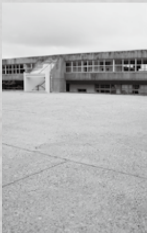
▲今後の利活用が期待される旧岩和田小学校

この広大な敷地を町の活性化に繋げるため、企業誘致についても検討を進め、官民一体となった町の活性化及び施設の利用方法について協議検討を進めます。