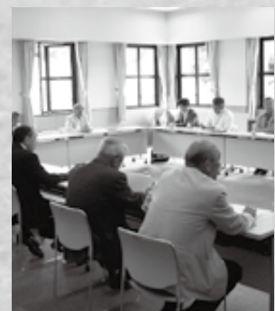
▲第1回検討委員会の様子

今年度委員会は重要検討項目として、旧御宿高校跡地、旧岩和田小学校の2点を議題としています。