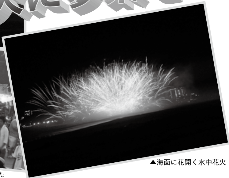
▲海面に花開く水中花火

キャンペーン当日は保護司会が中心となり、いすみ警察、教育関係者、町の中学生、その他各種団体と協力しながら通勤者や通学中の生徒にボールペンやポケットティッシュなどを配布し、青少年の健全育成と非行防止を呼びかけました。