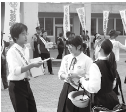
▲御宿中生徒会も協力して呼びかけ

キャンペーン当日は保護司会が中心となり、いすみ警察、教育関係者、町の中学生、その他各種団体と協力しながら通勤者や通学中の生徒にボールペンやポケットティッシュなどを配布し、青少年の健全育成と非行防止を呼びかけました。