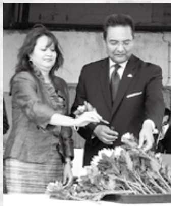
▲サン・フランシスコ号追悼式に出席。献花を行う市長夫妻。

テカマチャルコ市から公人の来町はドン・ロドリゴの上陸以来、403年目の事となります。