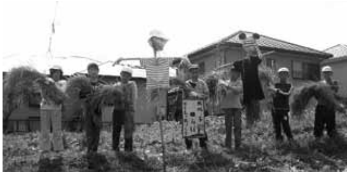
▲5年生みんなで力を合わせて

自分で植えた稲を収穫するこの貴重な体験は、地域の方々に支えられて実施しています。 子どもたちは、しっかりと実った稲穂を、力を合わせて楽しみながら刈り取っていました。