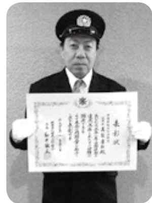
【指導部長】 たかなし やすひろ 高梨 康弘 日本消防協会会長 精績章