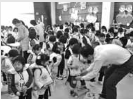
▲みんな上手に着用出来ました。

今後はライフジャケットを用いた訓練を実施し、素早くライフジャケットを着用して安全に避難ができるよう取り組んでいきます。