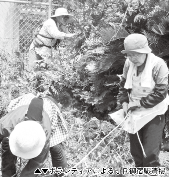
△▽ボランティアによるJR御宿駅清掃