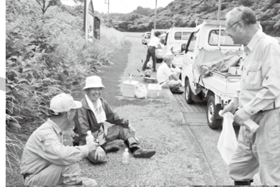
▲▼さくらワーキンググループ

今月号では、「地域づくりの担い手」であるボランティアグループの活動を紹介します。