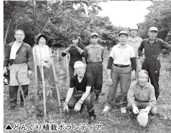
▲どんぐり植栽ボランティア