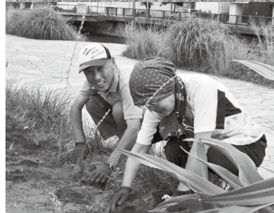
▲▼おんじゅく花の会