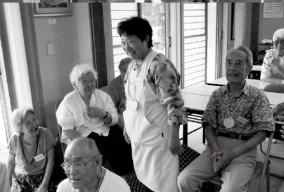
△▽「ほっとサロン」ボランティア