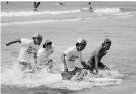
▲海開きに行われた海難救助の デモンストレーション