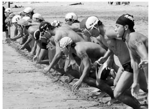
▲以前開催された国内大会の様子 国際大会・国内大会合わせての開催は全国初。

開催期間中には、日本と各国の選手が町内の小学校を訪問する交流イベントを実施。御宿の子どもたちにライフセービング