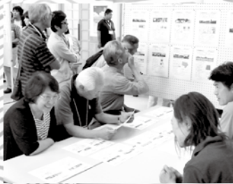
▲物件情報紹介ブースの様子 今回も町内外の不動産業者に協力してもらい、物件の情報提供を行いました。

また、以前実施したツアーを通じ、御宿や南房総地域に興味を持ち、実際に移住をするため不動産業者を訪れた方もいるそうです。