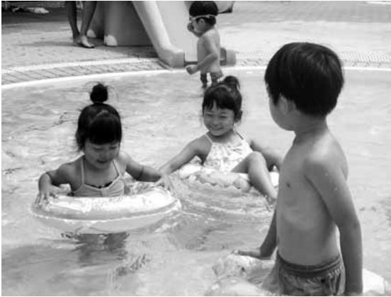
▲プールで遊ぶ子どもたち 皆さんが楽しく遊べるよう、安全な環境づくりに取り組んでいます。