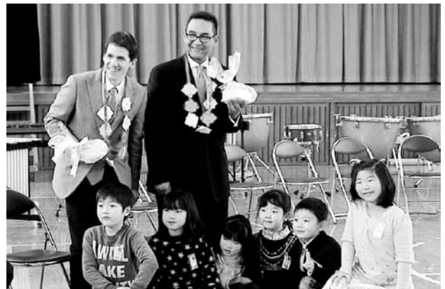
▲町内小中学校訪問

今後町では、両市町の絆を更に深めるため、テカマチャルコ市、国際交流協会、御宿アミーゴ会等と協力しながら、国際交流事業を行っていきます。