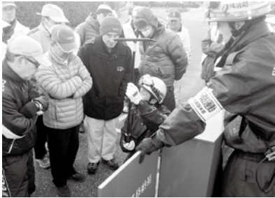
▲消火栓取扱説明会