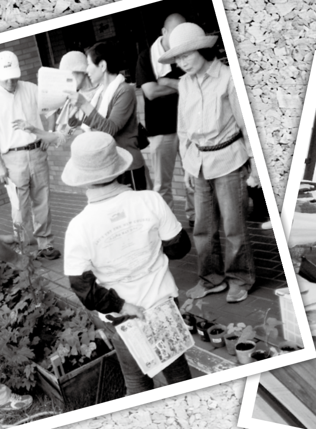
文化体験プログラム 習字教室(右) グリーンカーテン教室(上)