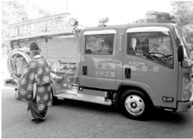
▲消防車両安全祈願の様子