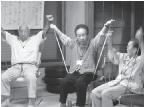
▲元気いきいき教室

昨年度より「元気いきいき教室」は皆さんが参加しやすいよう、従来の通所型から巡回型に変え、町内各所で実施しています。講話や体操、クイズ等を通して、介護予防に必要な知識、運動方法を学ぶことができます。今年度は6月から実施を予定しています。