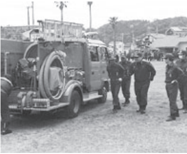
▲消防団統一訓練の様子

【設置場所】御宿中学校、浅間山、布施小学校、旧御宿高校、御宿台多目的広場、サンドスキー場