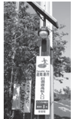
▲ソーラー照明灯付 避難所看板