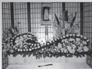
費用をおさえた 心のもったお式

藤ライフでは、大切な方との お別れの時間を「心ゆくまで」 お過ごしいただくお葬式を考 え、ご家族が雑事や段取りに振 り回されることなく、親しい方 とともに、思い出や悲しみをゆ っくりとわかちあうことがで きるよう心がけております。