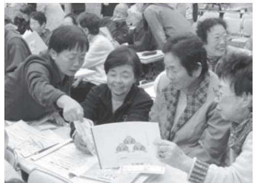
▲勝浦市と共同開催した「鶴亀学校」